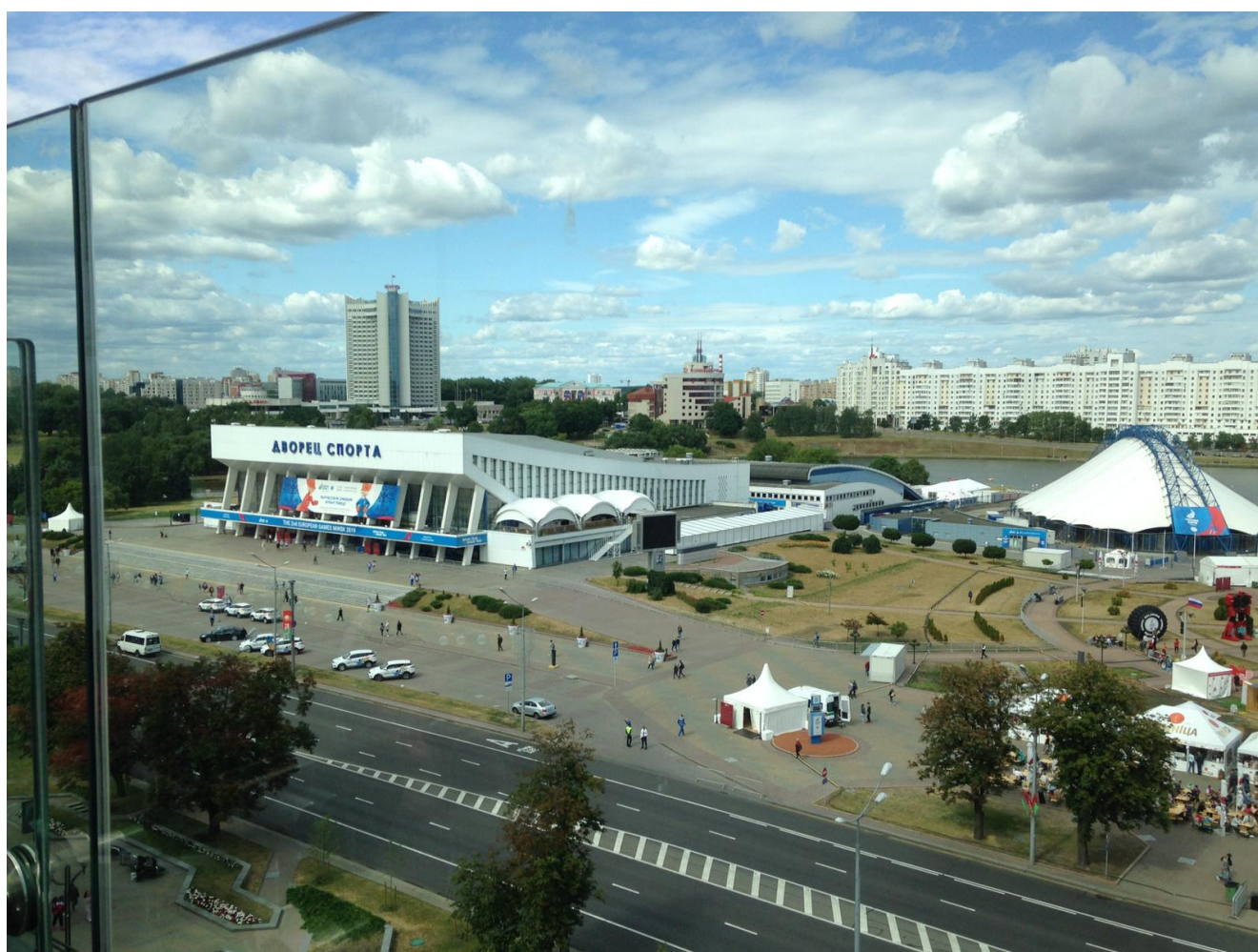
Дворец спорта, где проходили Игры