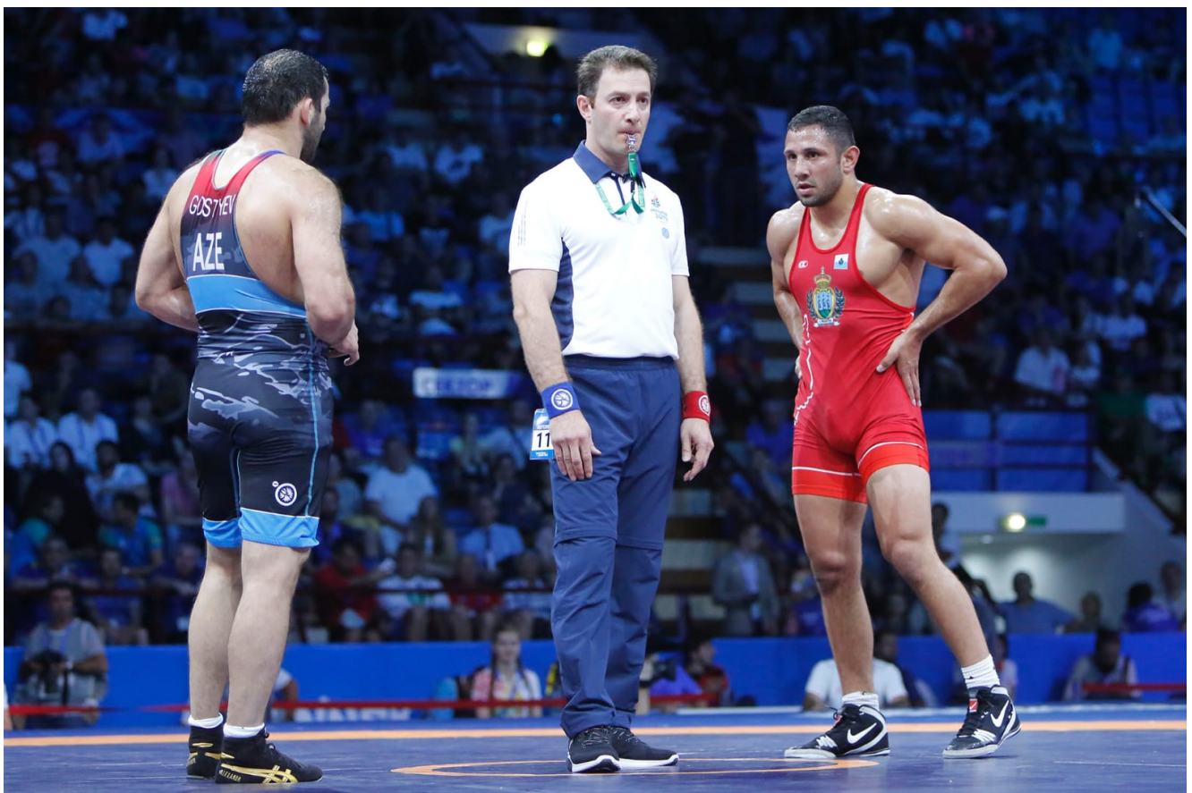
Схватка за бронзовую медаль между представителями Сан-Марино и Азербайджана