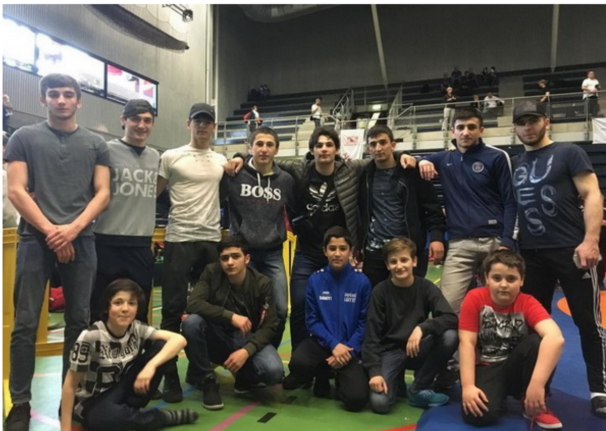
Вайнахи на Пасхальном турнире