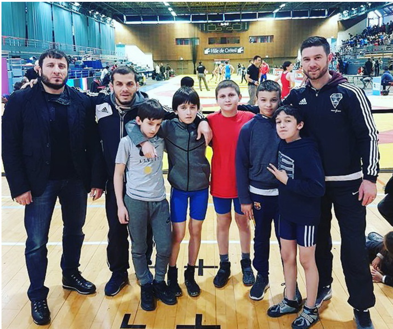
Команда из Соттевиля