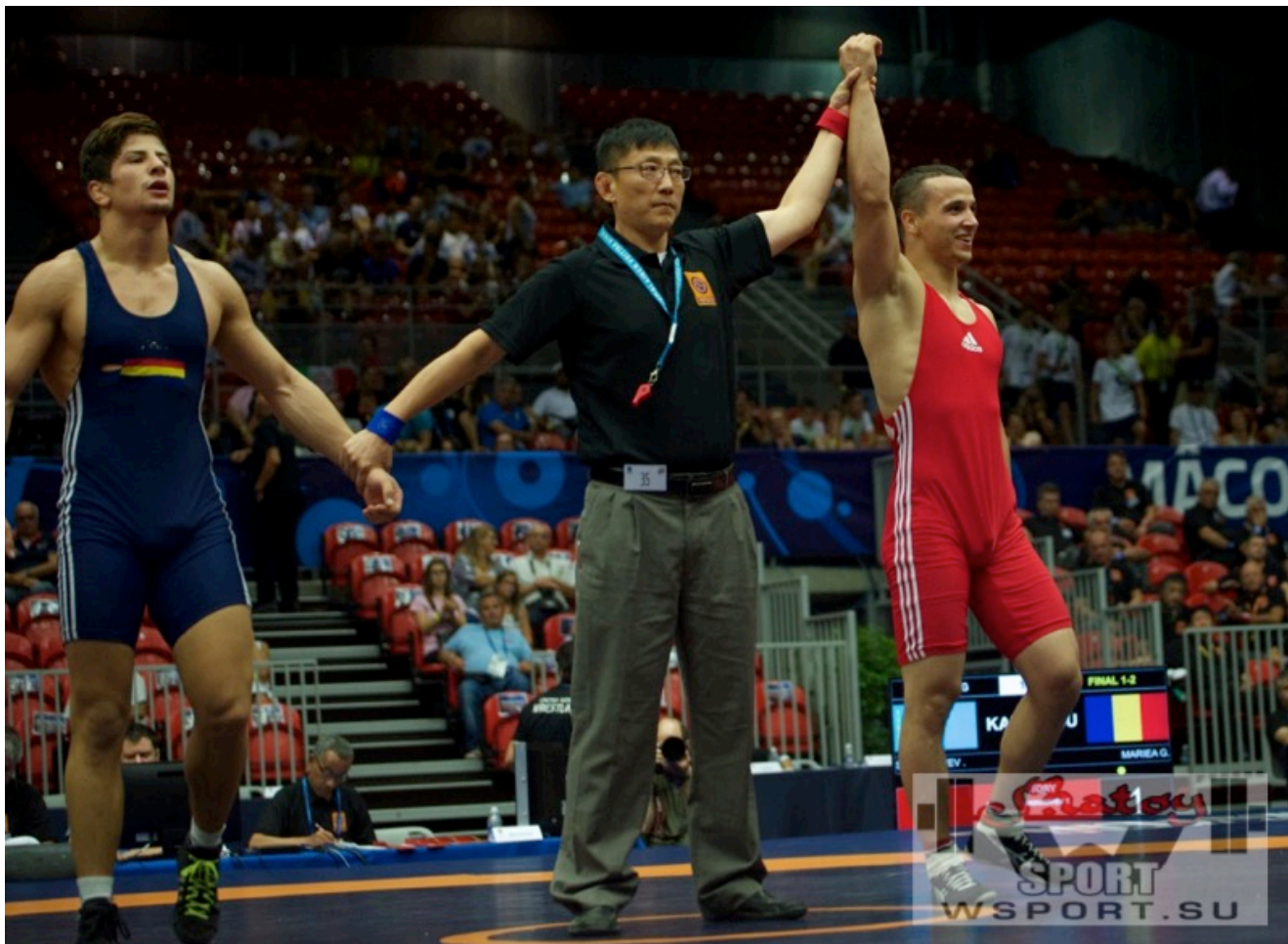
Тамерлан Шадукаев - чемпион мира-2016 среди юниоров