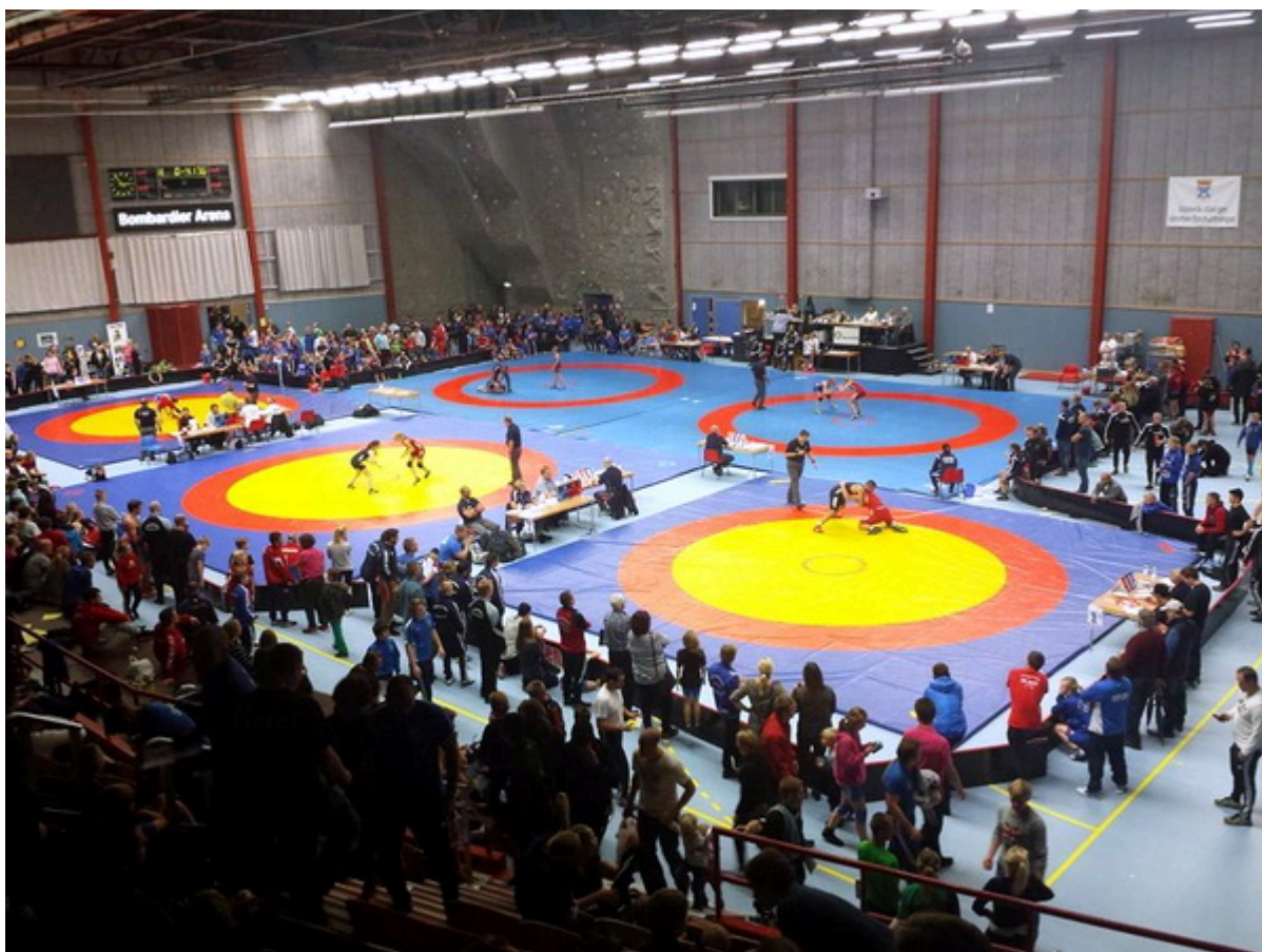
Турнир Mälarsipren проходит на 5-ти коврах