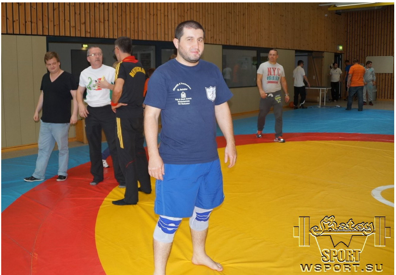
Судья должен поддерживать форму