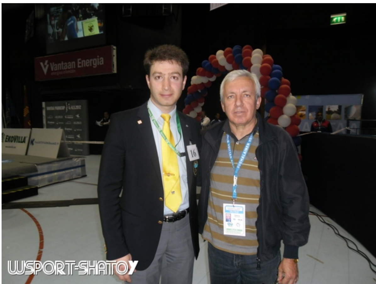
Теодорас Хамакас, Греция, вице-президент CELA.