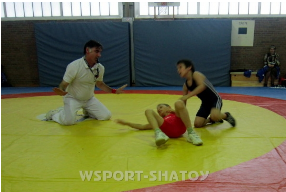
Иса за работой