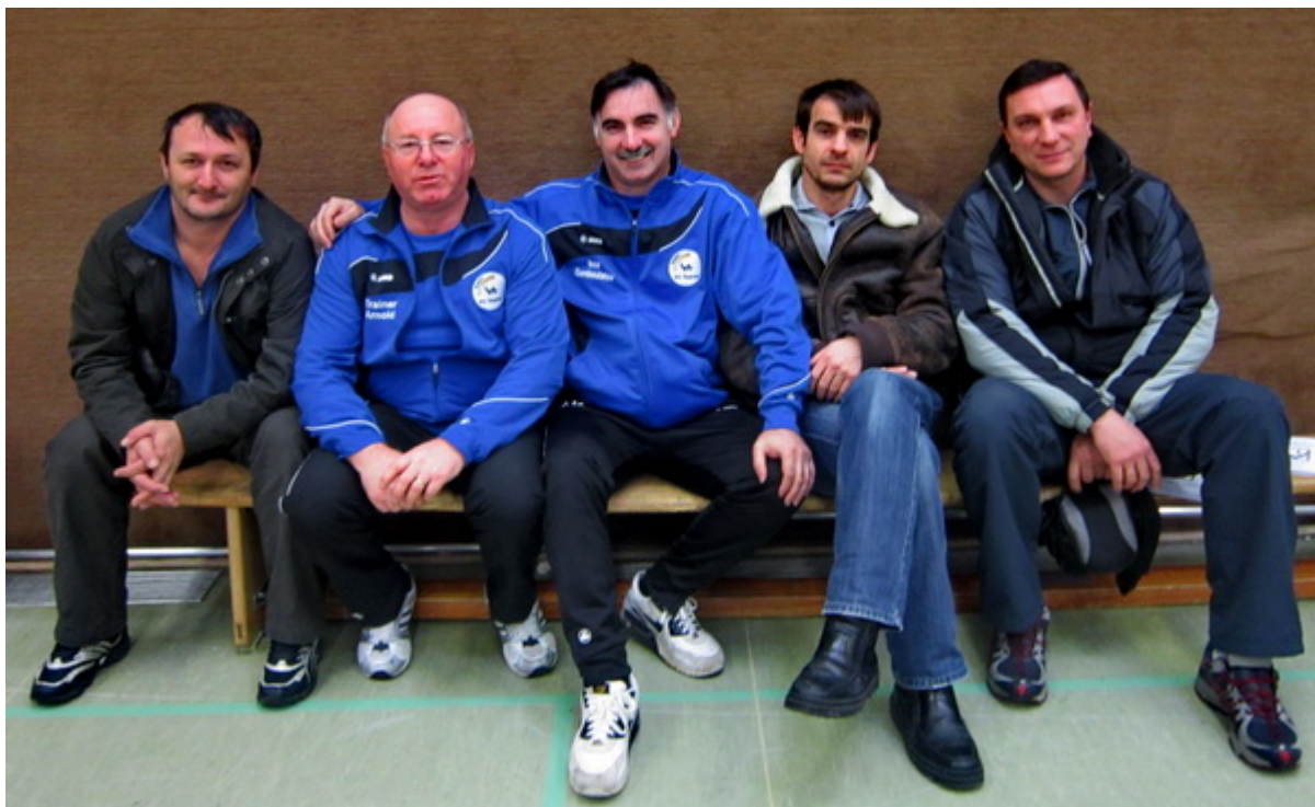
Руководство спортклуба "Раерен 2006", родители спортсменов