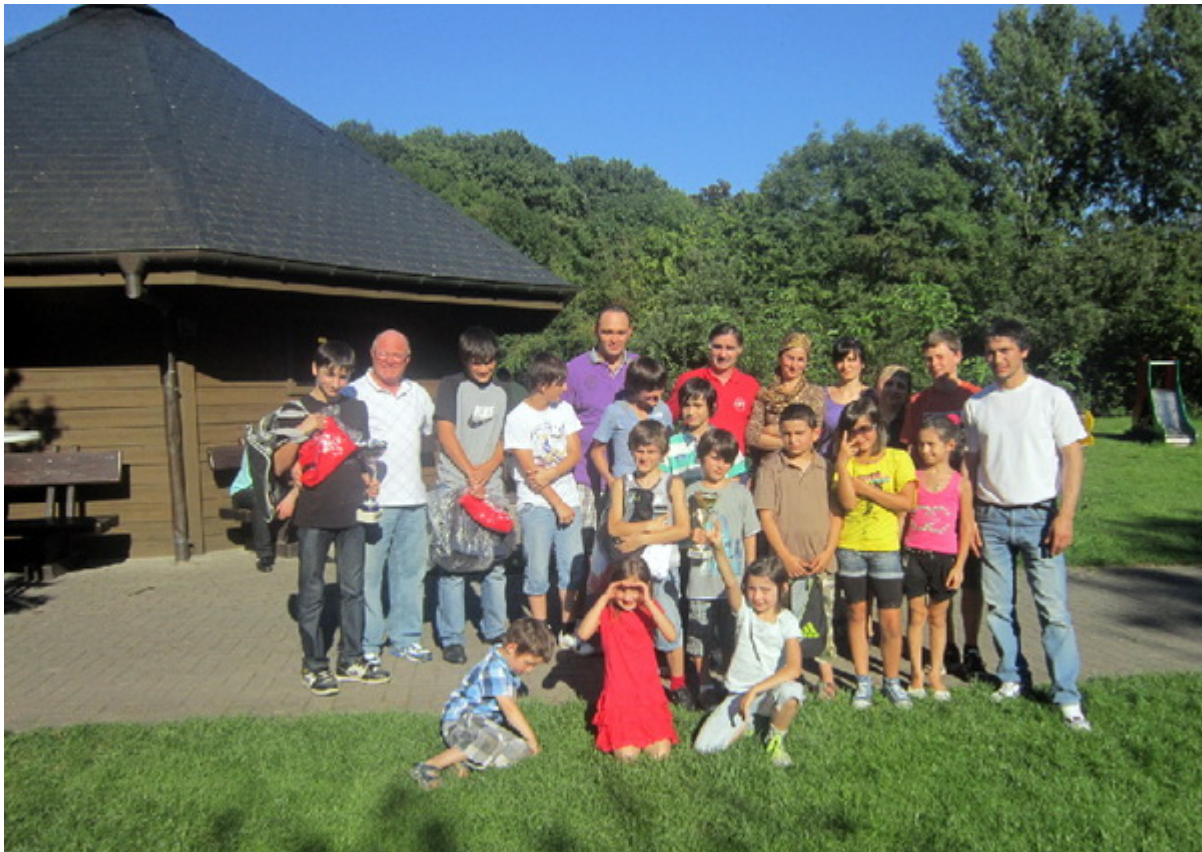
Спортсмены, их родственники, тренеры после награждения