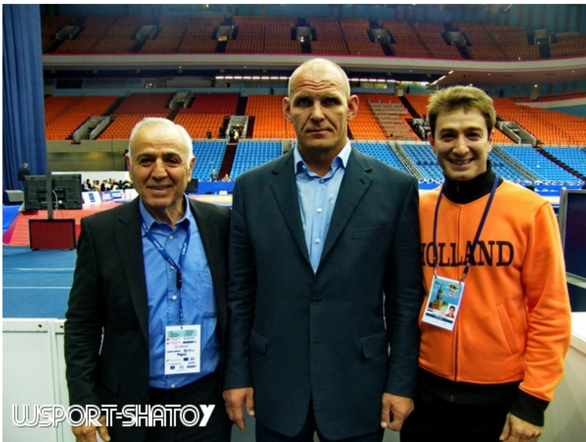
Сайдахмет Абдулаев, отец Айдамира, заслуженный тренер СССР, один из основоположников чеченской греко-римской борьбы. В центре - великий Александр Карелин.