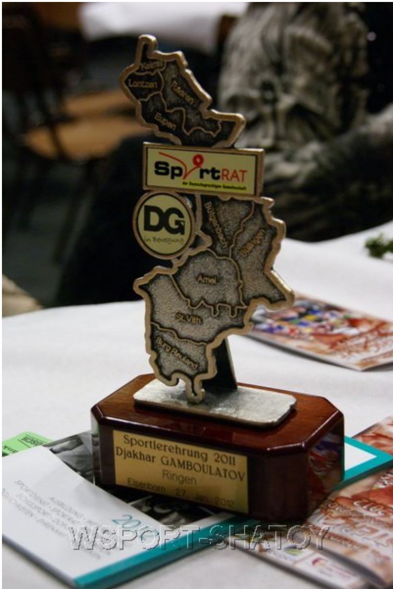
Приз лучшего спортсмена Восточной Бельгии