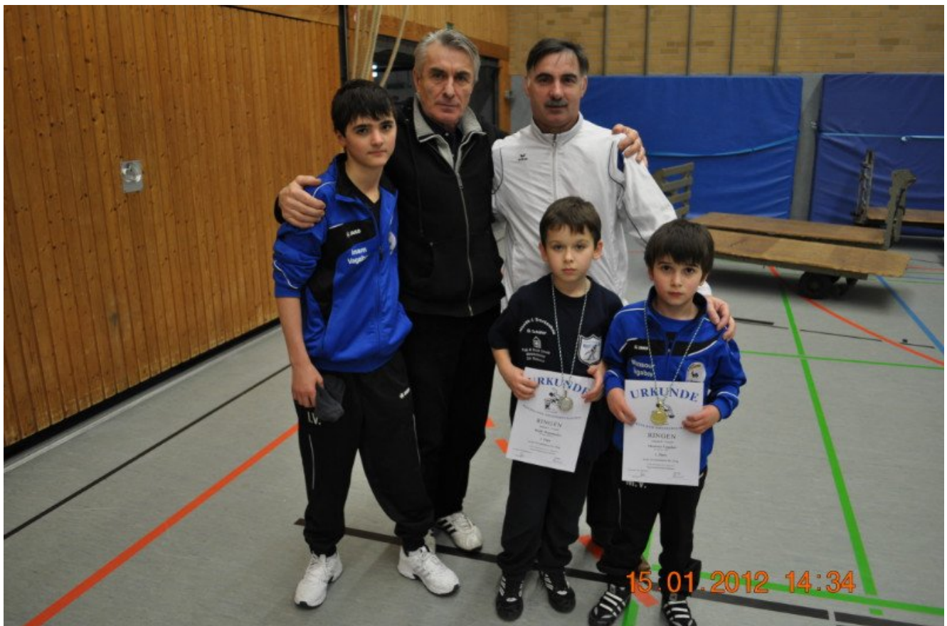
Известный чеченский актер Майрбек Магомадов приехал поболеть за внука Малика