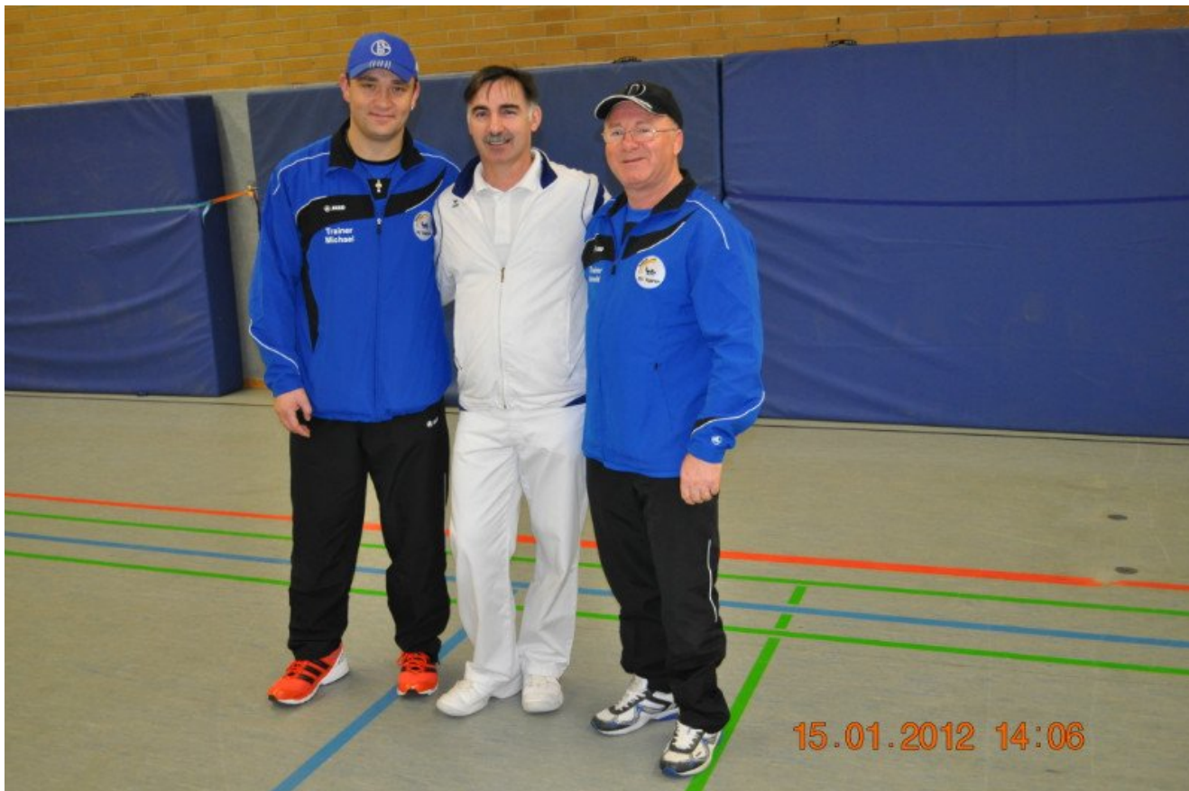
Руководство клуба "Раерен 2006"