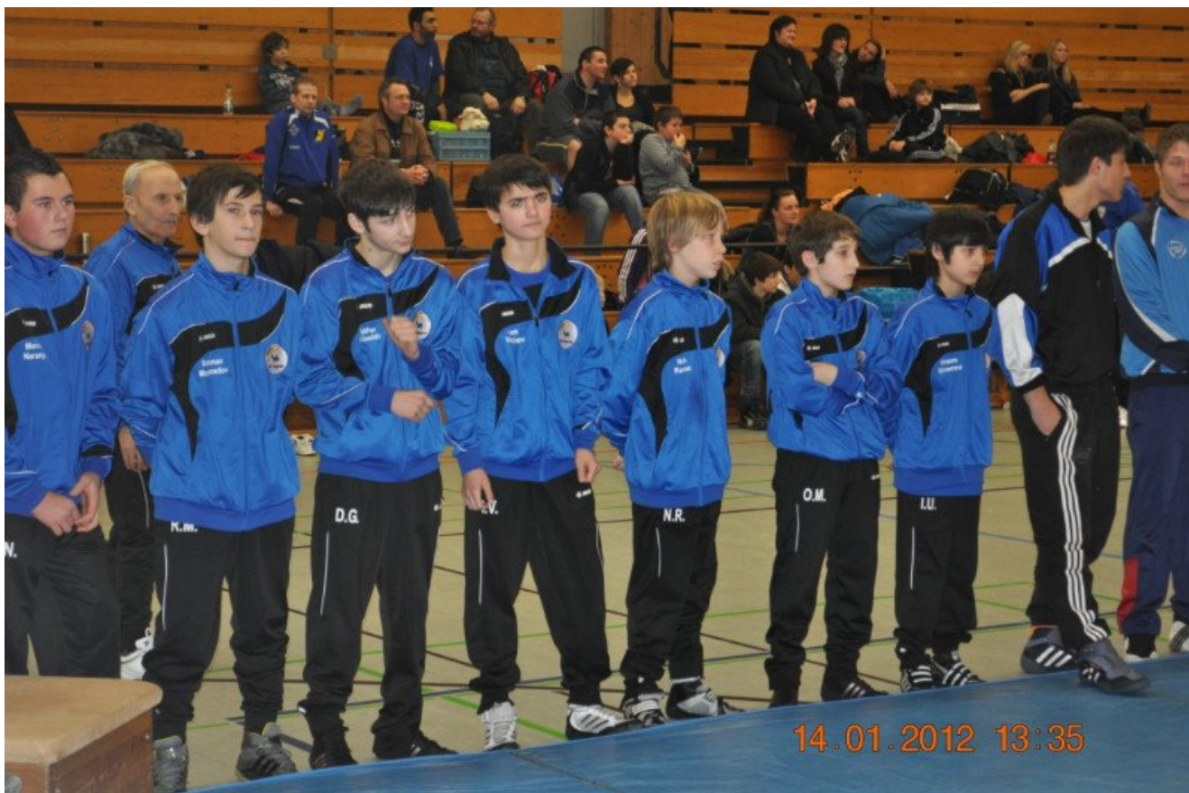
Команда "Раерен 2006"