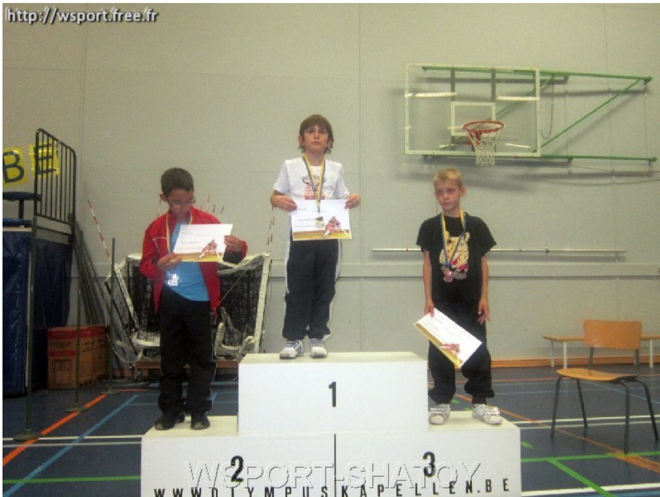
Чемпион Раджаб Магомедов