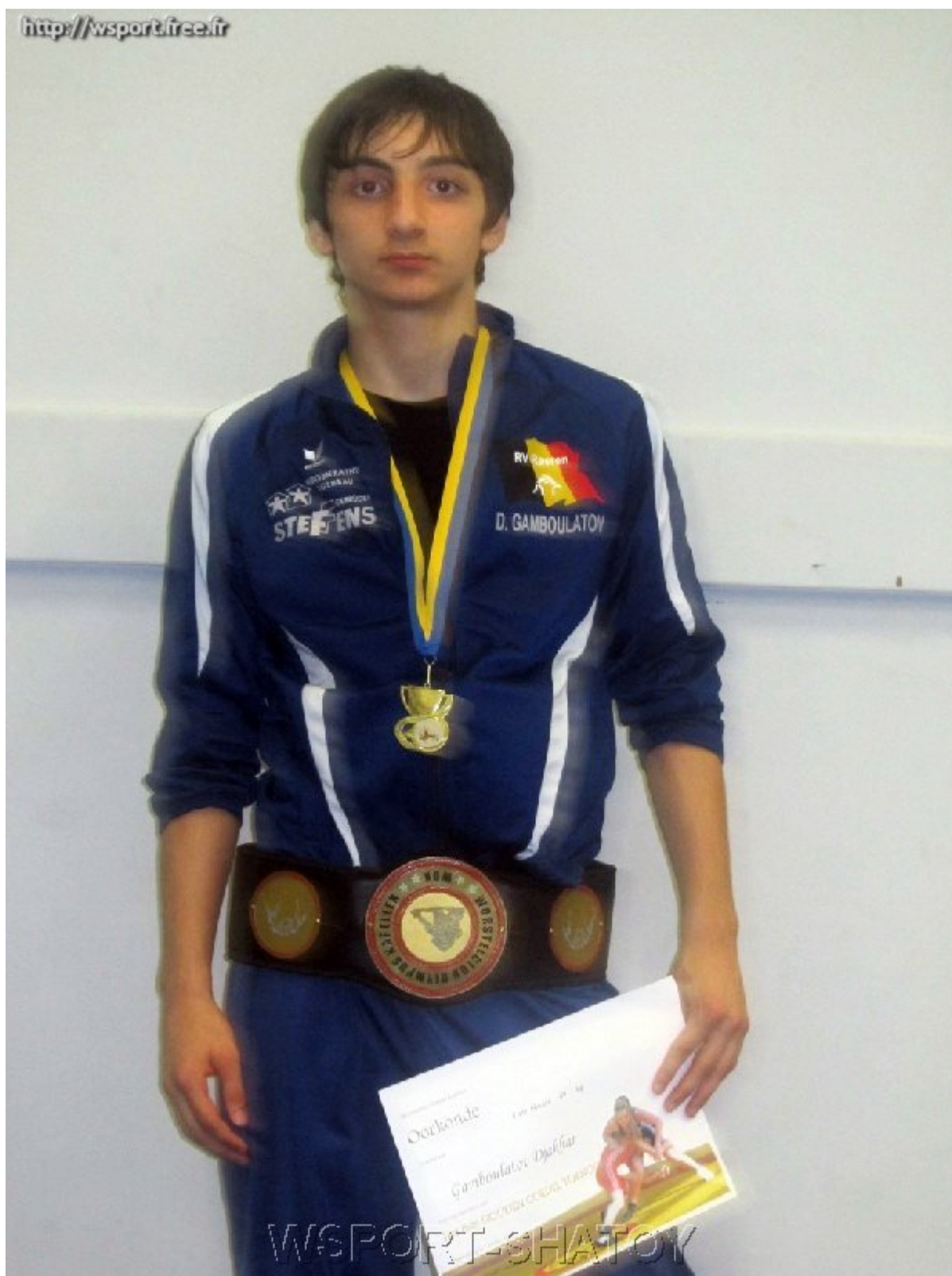
Обладатель "Золотого пояса" Джохар Гамбулатов