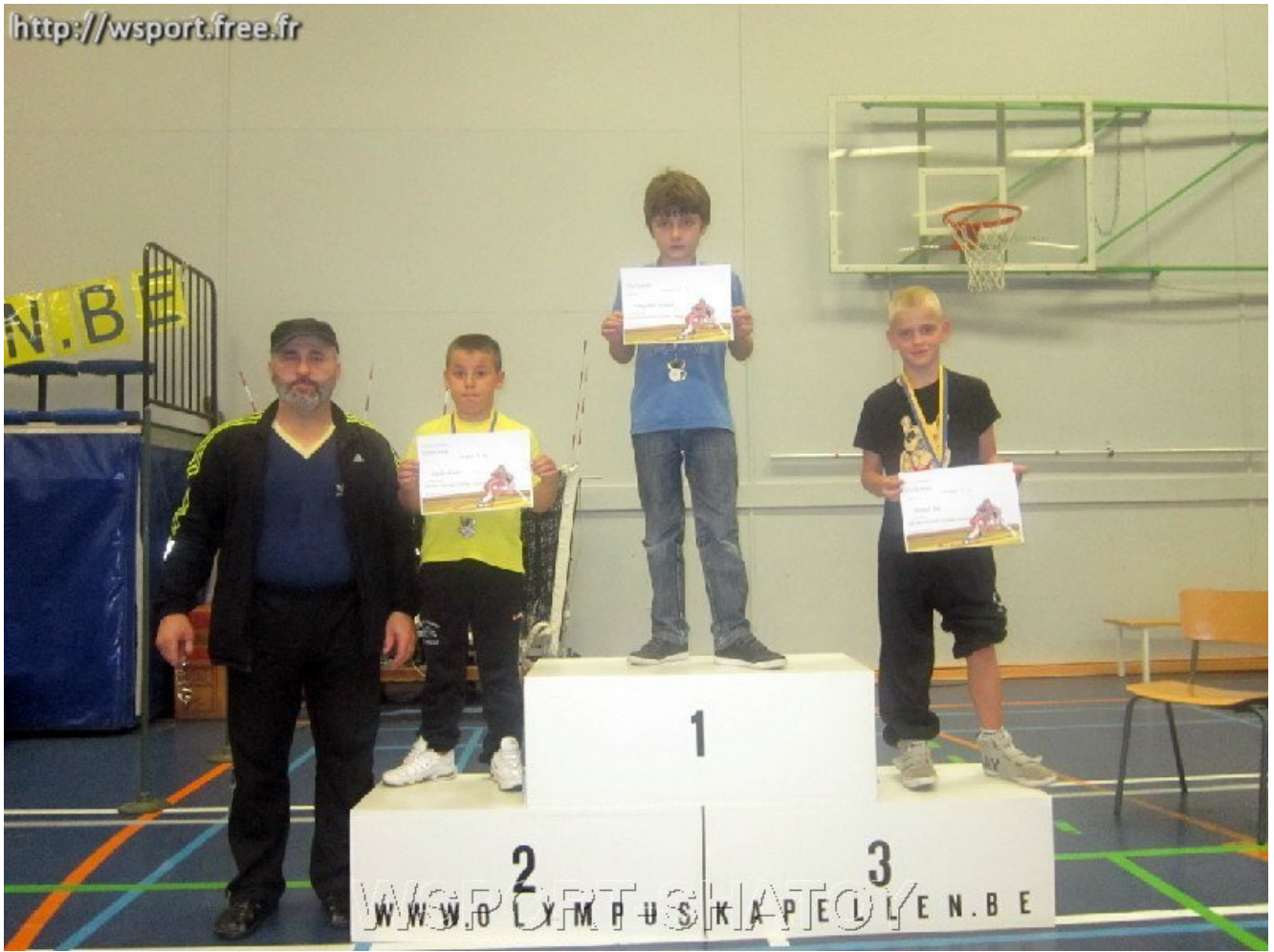
Чемпион Ахмед Ибрагимов