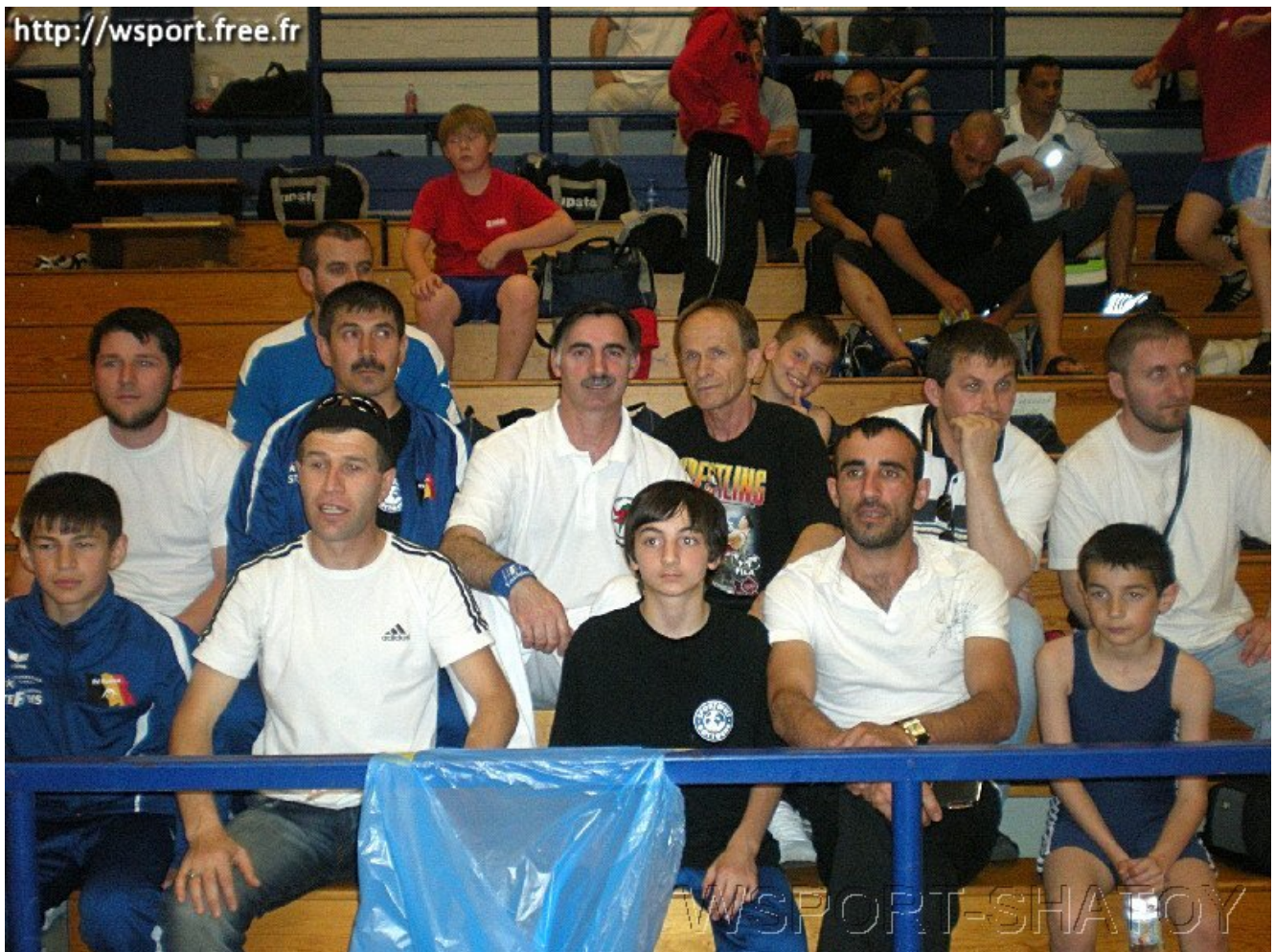
Спортсмены, тренеры, болельщики, родители