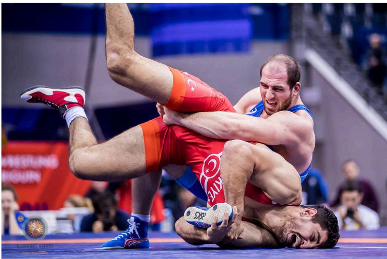
Анзор Хизриев - Таха Акгуль