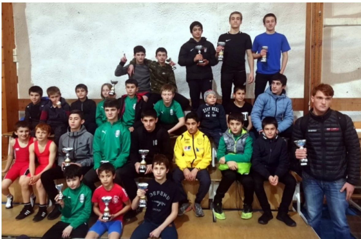
На первом турнире