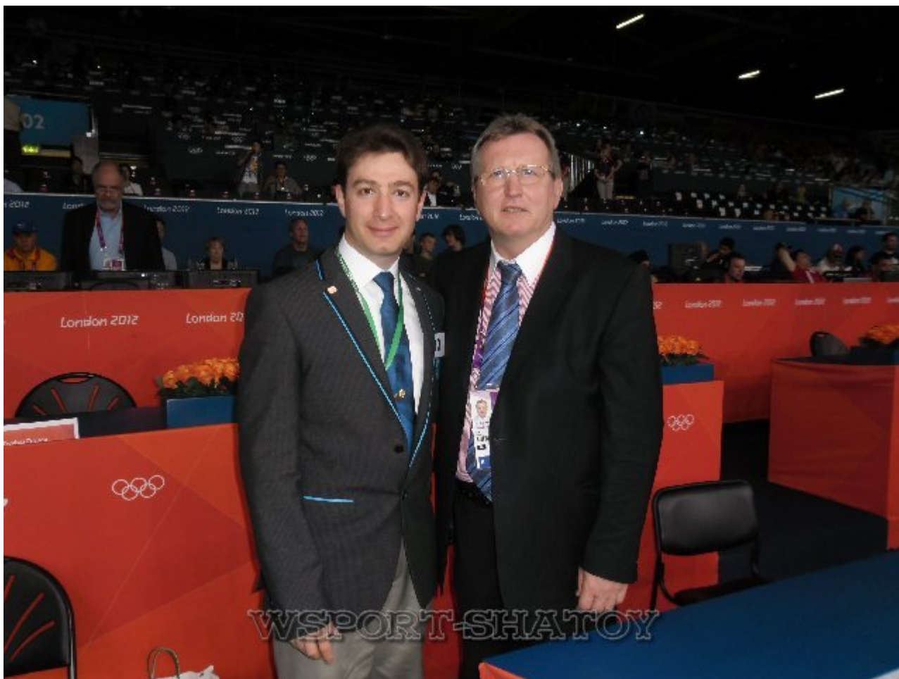
Айдамир и Чаба Хегедуш (Президент Федерации борьбы Венгрии и технический делегат FILA в Лондоне, олимпийский чемпион 1972 года в Мюнхене).