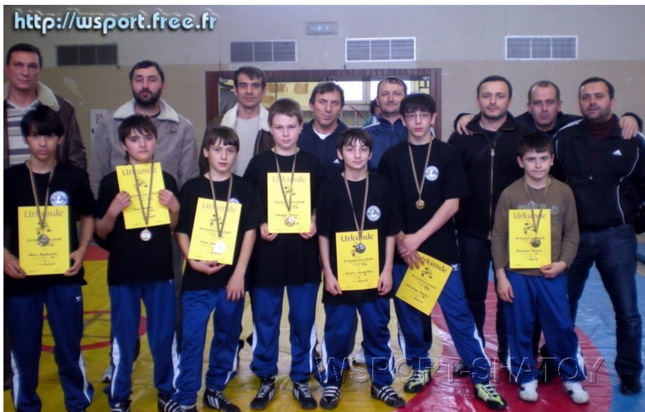
Спортсмены, тренеры, судьи, родители