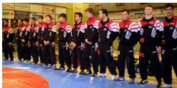
Вторая команда «Раерен 2006»