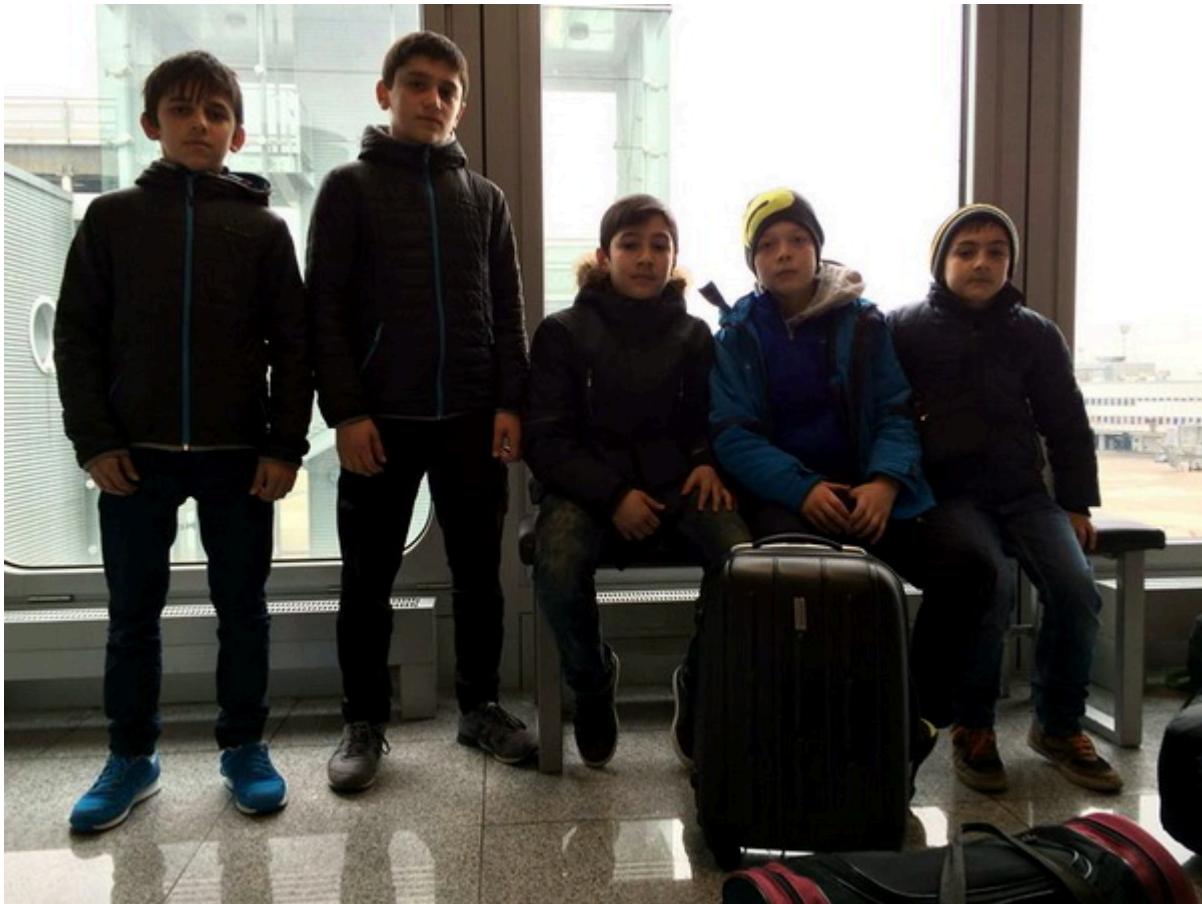
Борцы клуба "Вайнах-Эссалем" на пути в Таллин