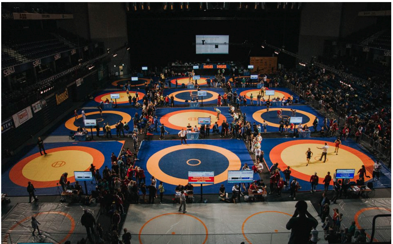
Соревнования идут на 12 коврах