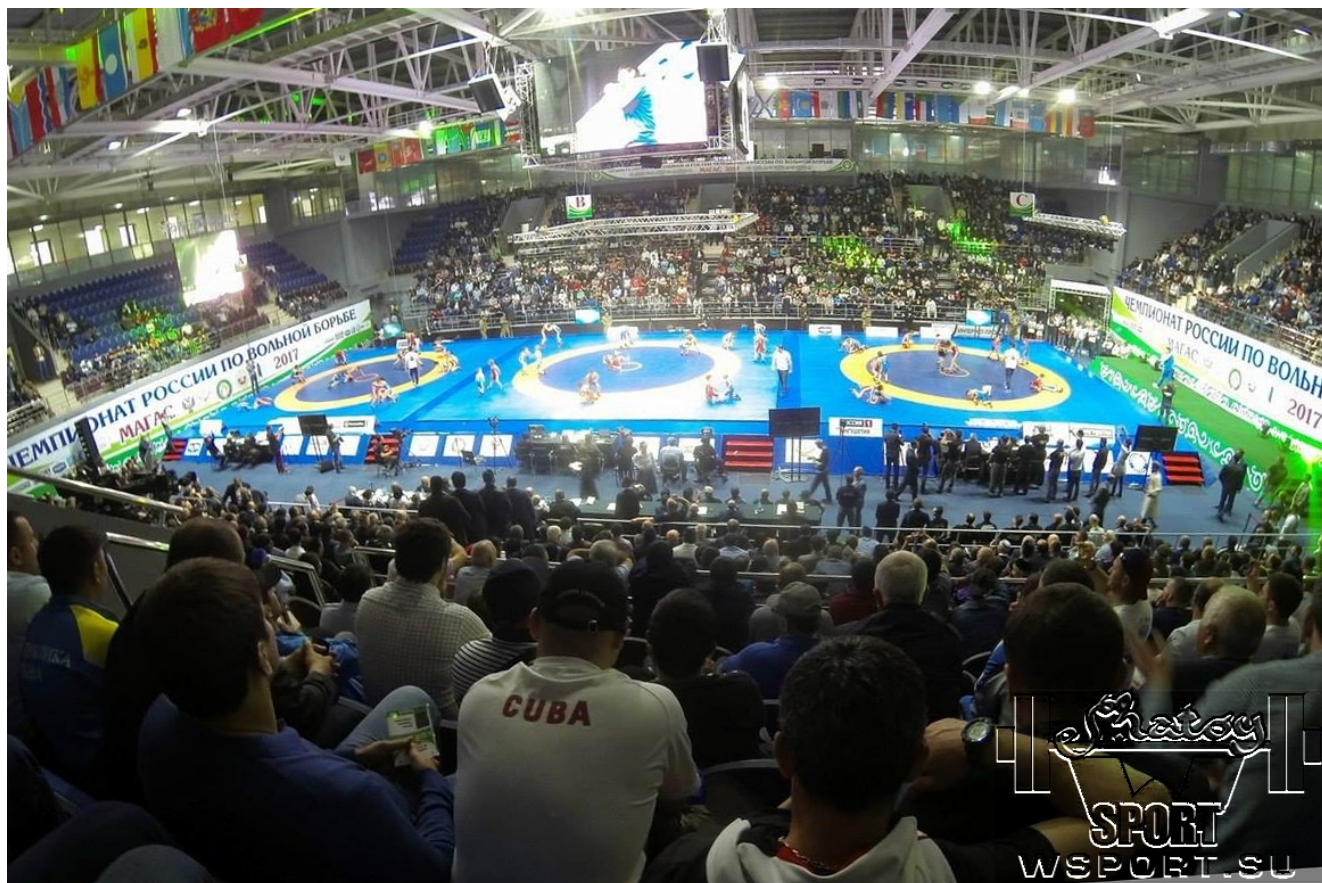
Чемпионат России-2017 по вольной борьбе в Магасе