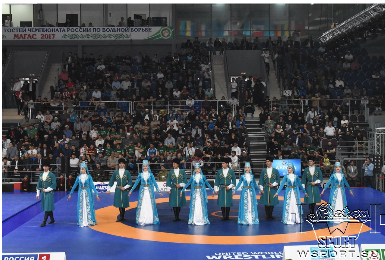
Торжественное открытие чемпионата России-2017

Беседовал Мовлади Абдулаев.