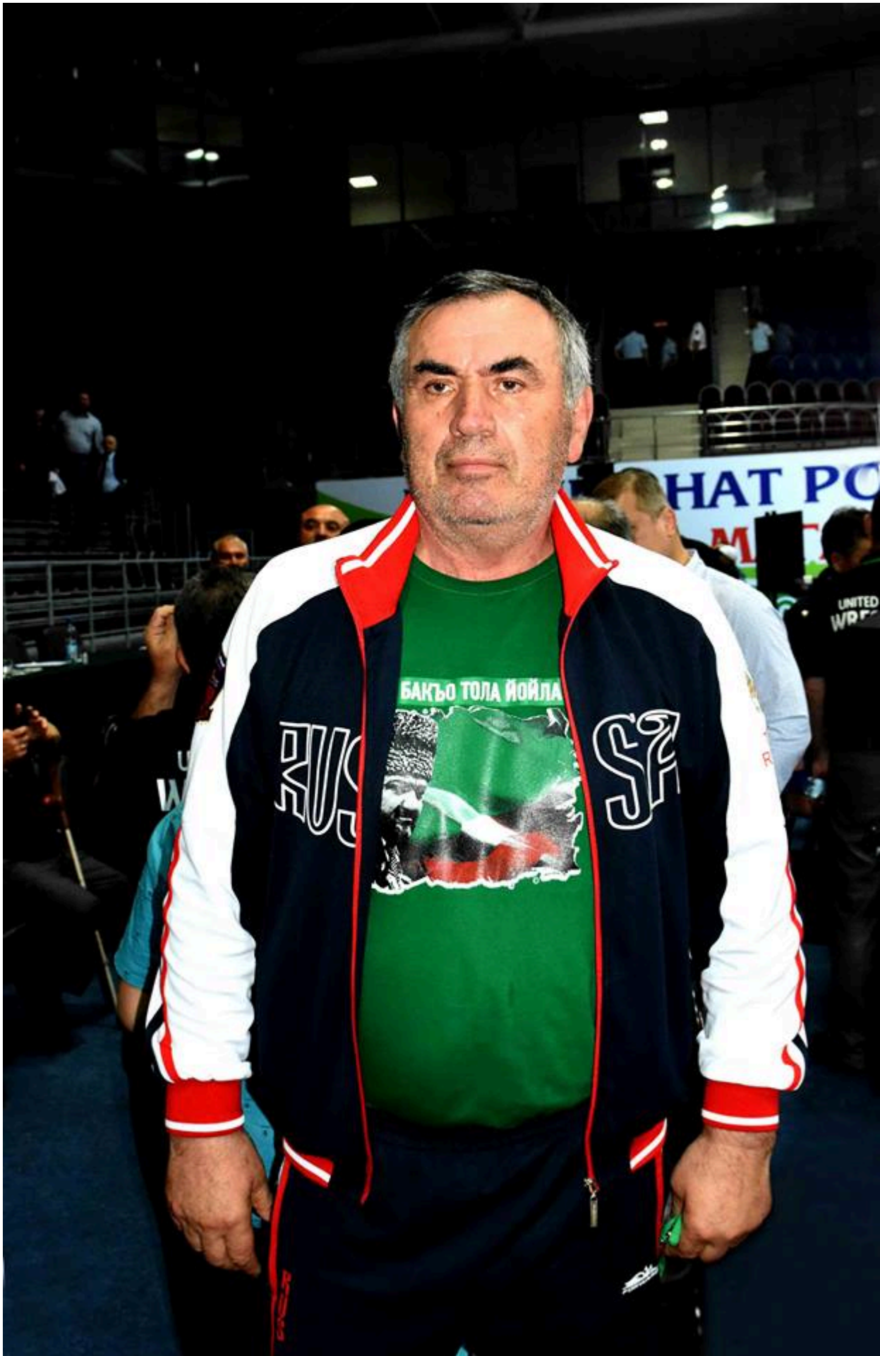
Старший тренер сборной России и Чеченской Республики Жаа