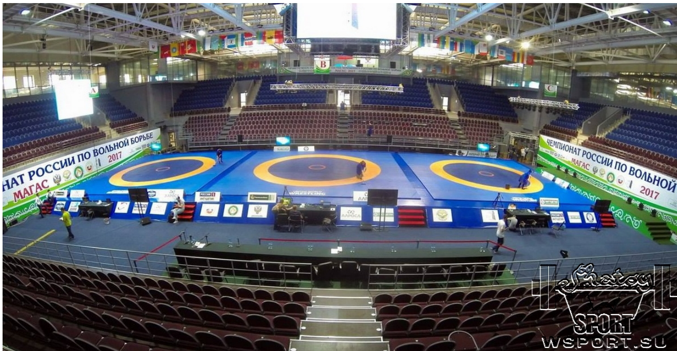
Зал соревнований в Магасе