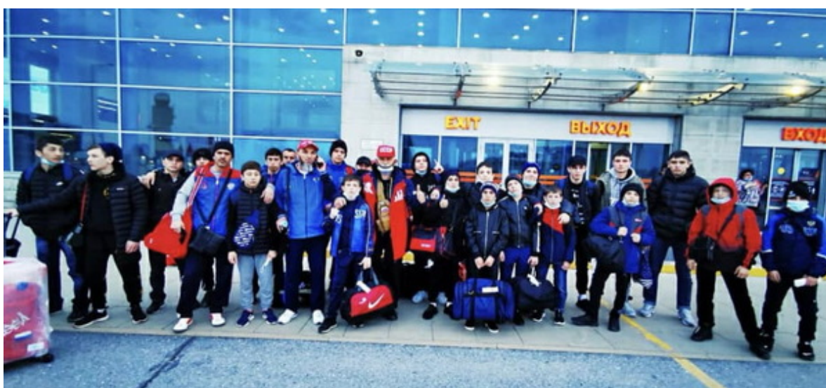
Команда Чеченской Республики на первенстве России