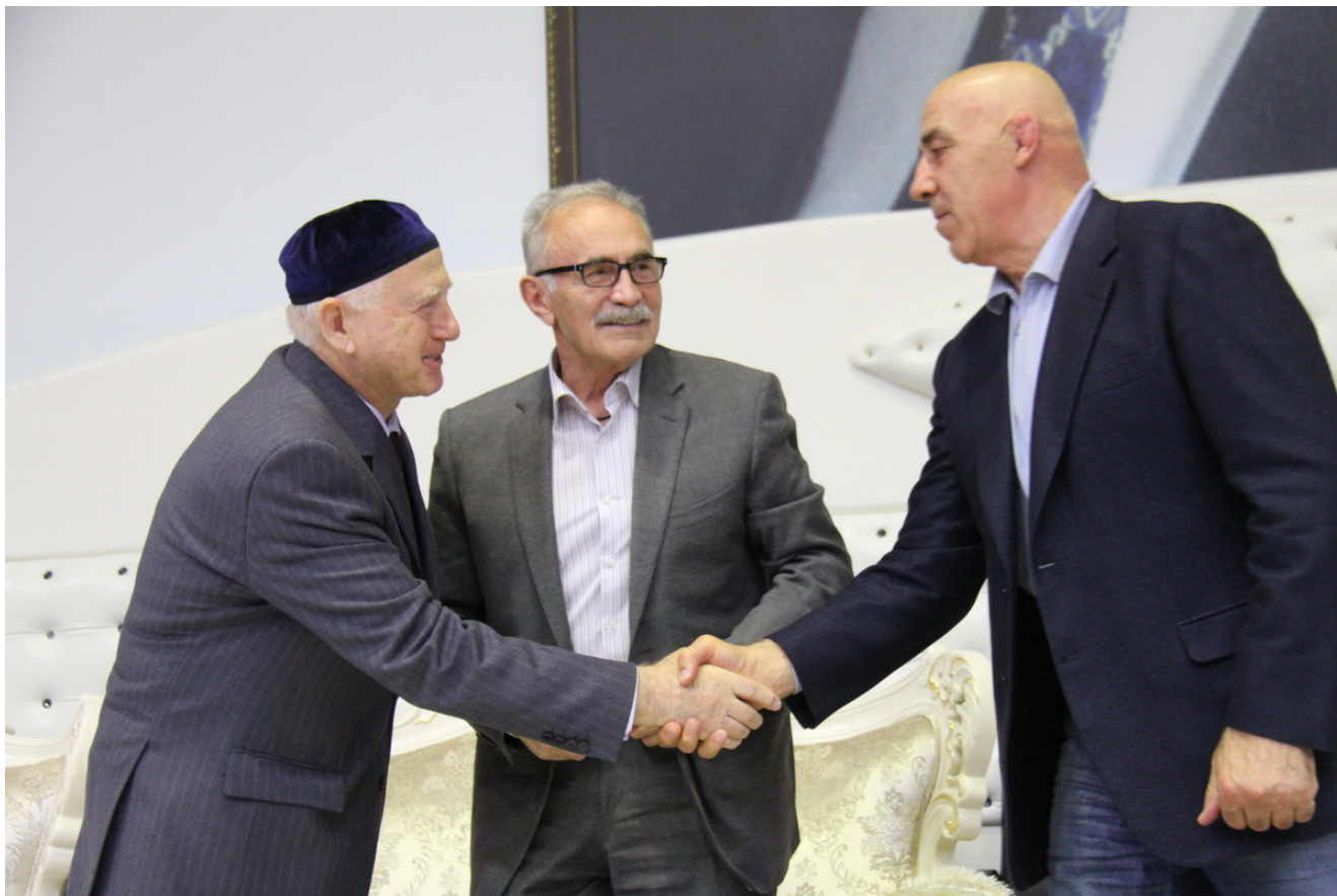
Ветерана чеченского спорта приветствует главный тренер сборной России по вольной борьбе Магомед Гусейнов. Грозный, 10 октября 2015г.