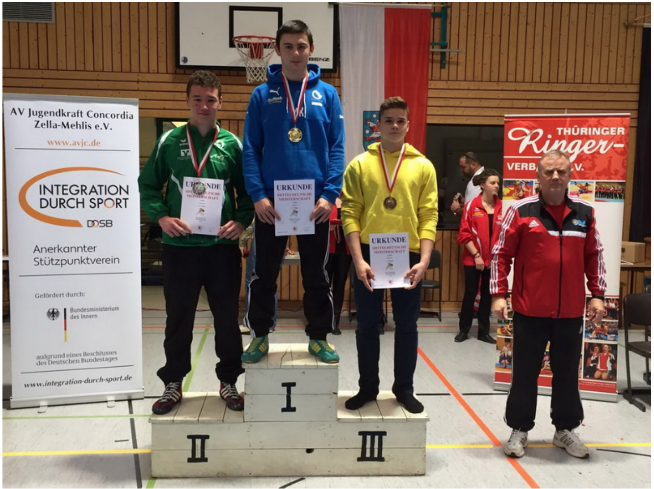
Чемпион Центральной Германии Муслим Кантаев