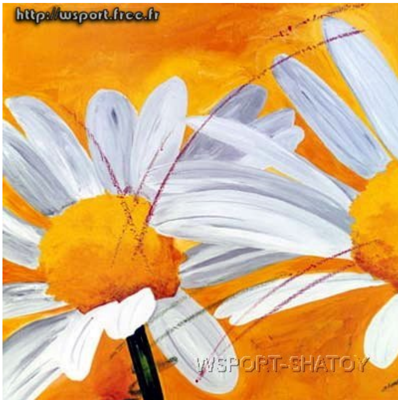
"Ромашки". Рисунок С.Долтабаева.