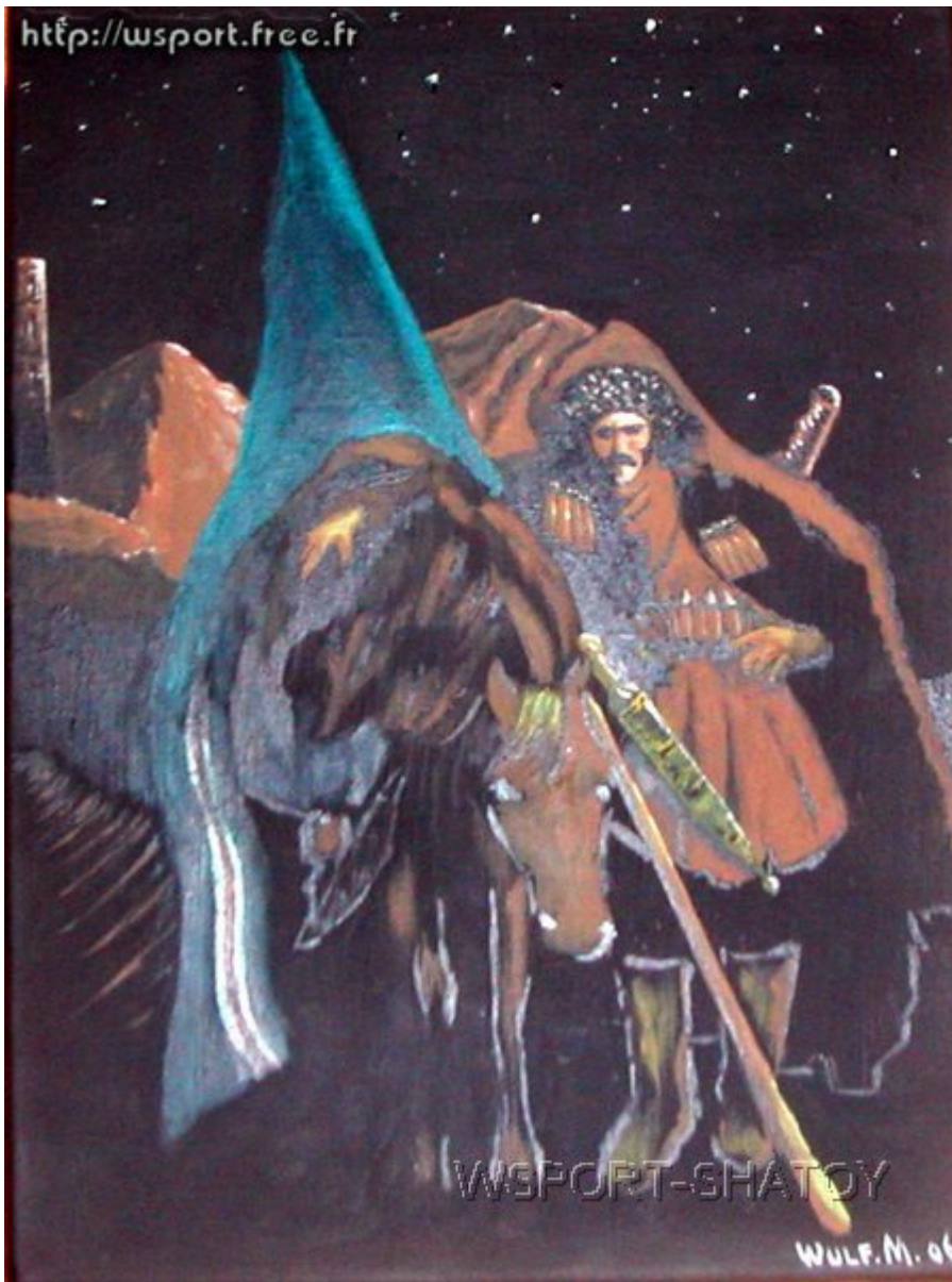
"Нохчо". Рисунок С.Долтабаева.