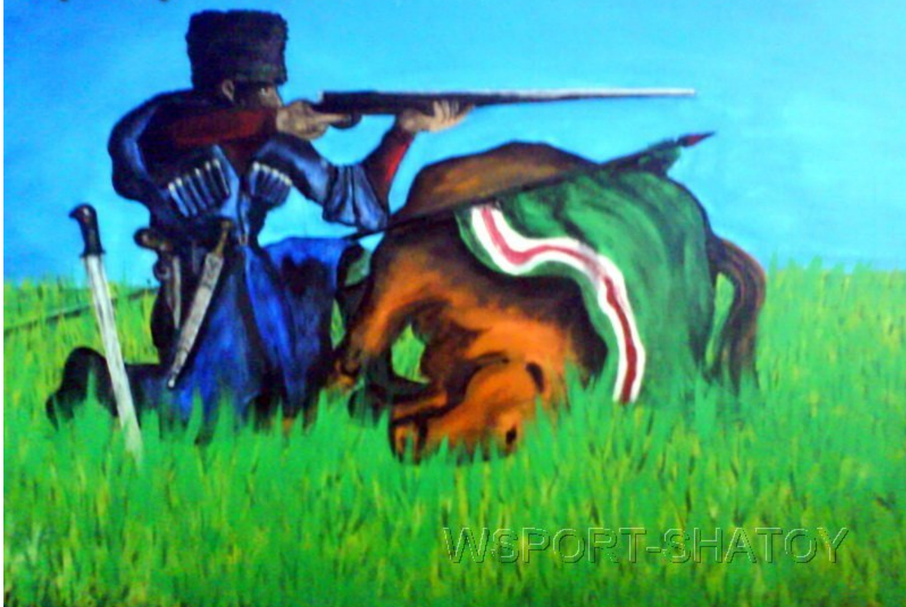
"Стрелок". Рисунок С.Долтабаева.