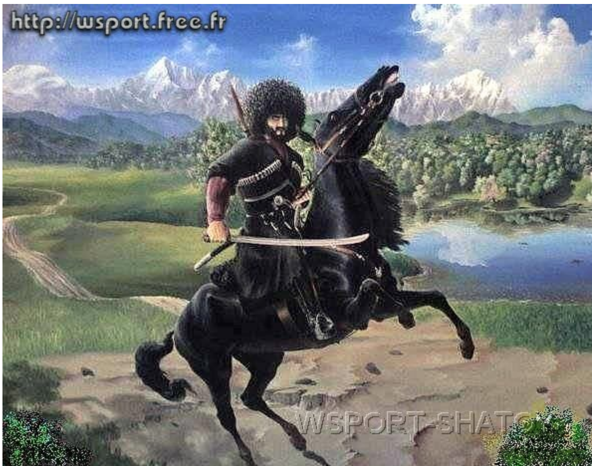
"Нохчо". Рисунок С.Долтабаева.