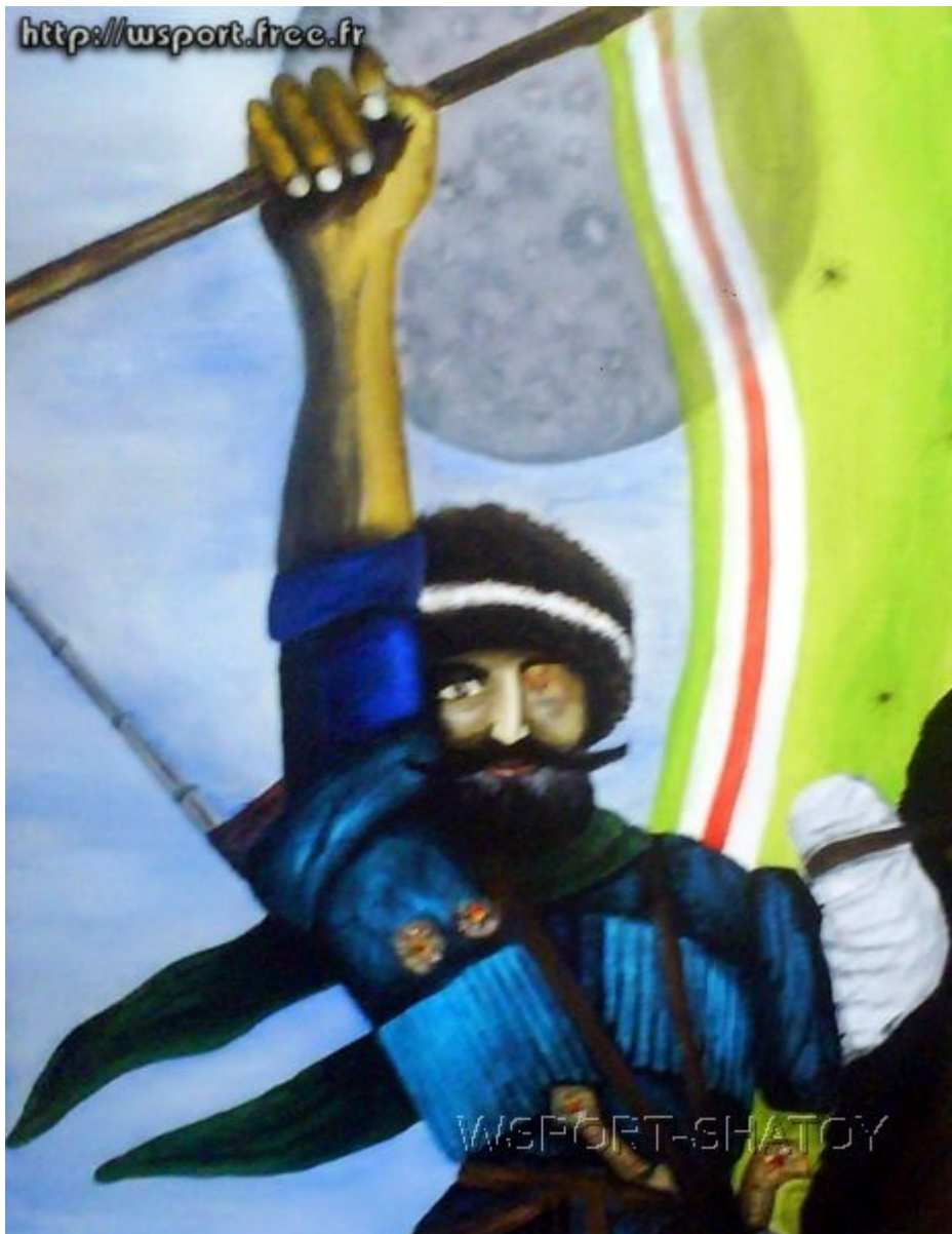
"Мой Байсангур". Рисунок С.Долтабаева.