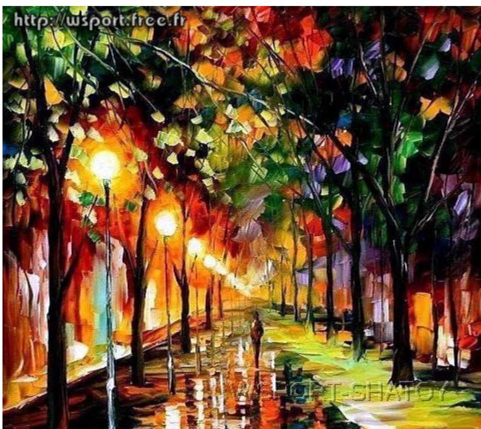
"Аллея". Рисунок С.Долтабаева.