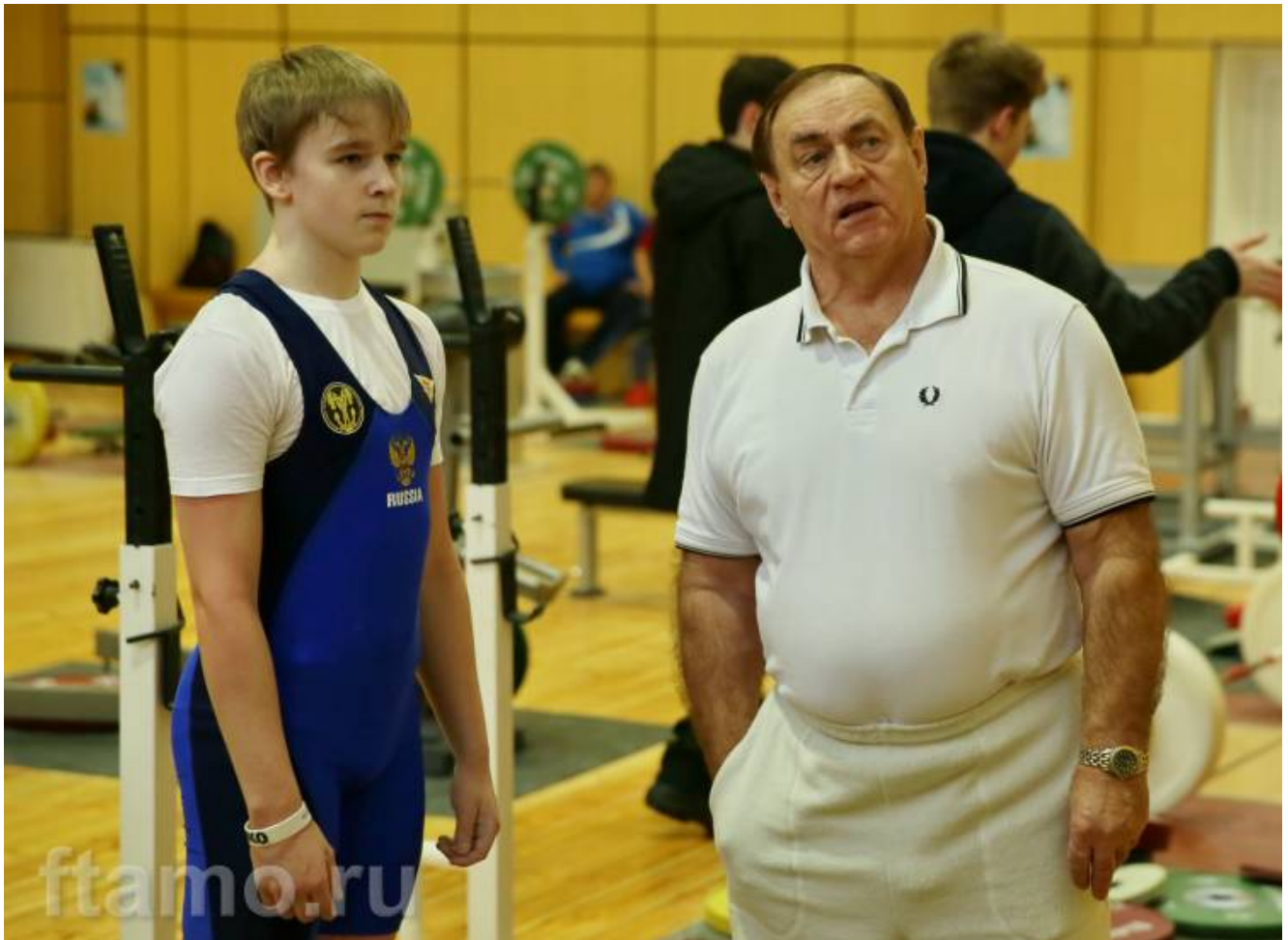
Почетный форумчанин сайта, заслуженный тренер СССР Олег Писаревский.