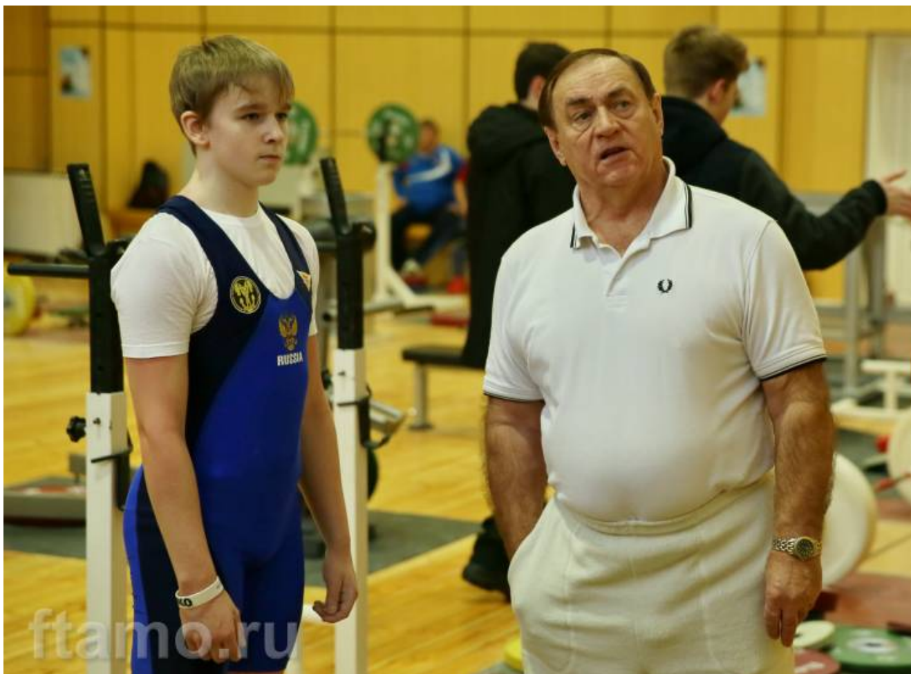
Почетный форумчанин сайта, заслуженный тренер СССР Олег Писаревский.