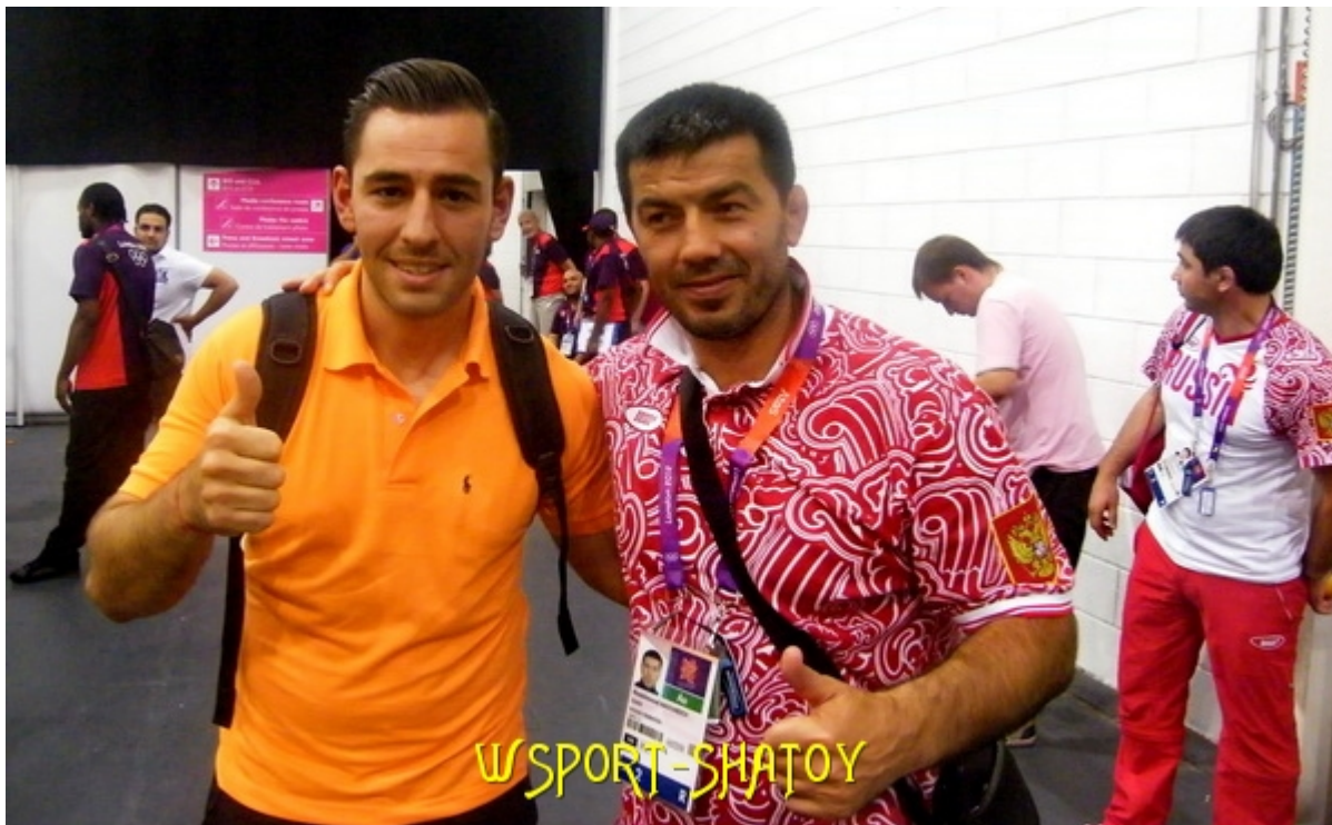
С тренером сборной России, олимпийским чемпионом Атланты-96 Хаджимурадом Магомедовым