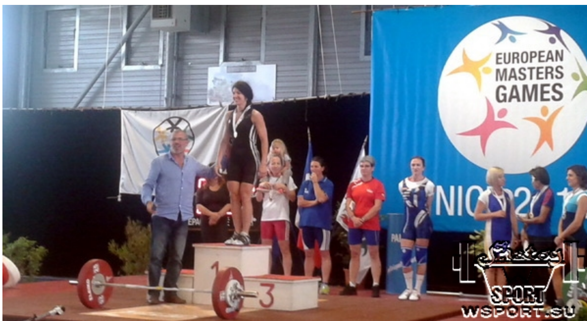
Вика ди Джорджи - чемпионка Евроигр-15