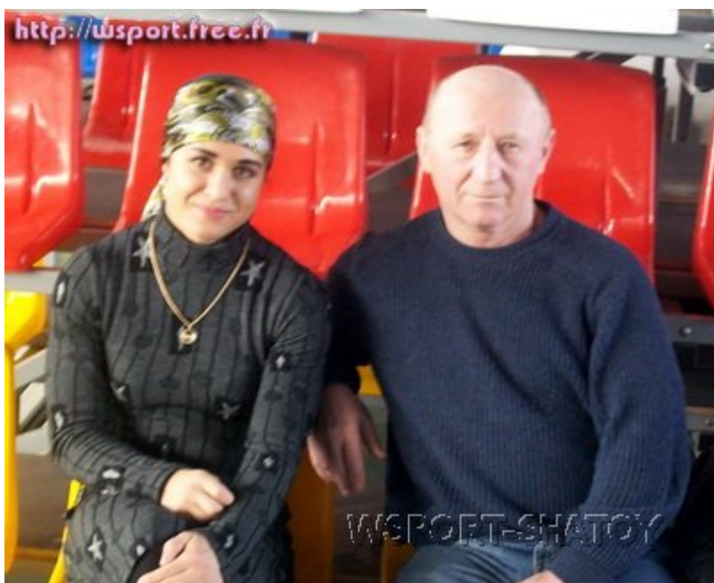
С главным тренером женской сборной России Солтаном Каракотовым