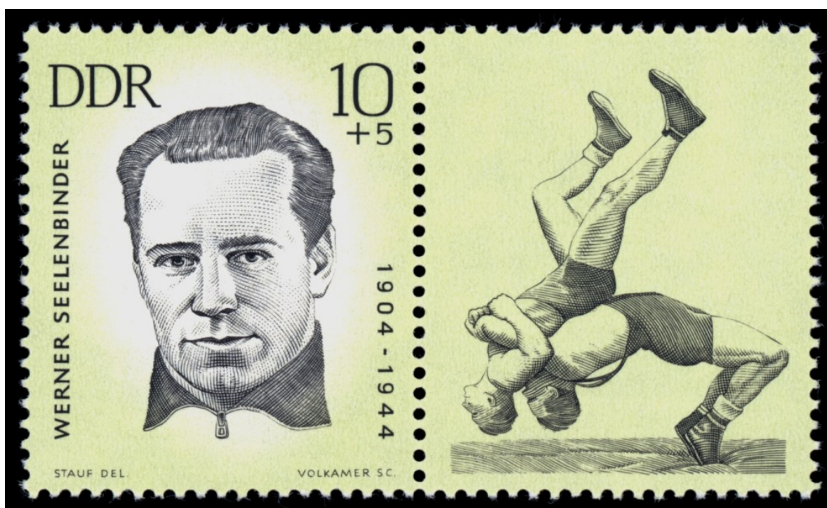
Почтовая марка, выпущенная в Германии в честь борца и

Надо сказать, что от рук фашистов гибли не только советские борцы. К примеру, в 1944 году гестаповцы за антифашистскую деятельность расстреляли известного немецкого борца полутяжелого веса Вернера Зееленбиндера – дважды бронзового призера чемпионата Европы по классической борьбе, немного не дотянувшего до пьедестала (4-е место) на XI Олимпийских играх 1936 года в Берлине. К слову, Зееленбиндер побеждал и на Спартакиаде народов СССР 1928 года, куда допускались иностранные борцы.