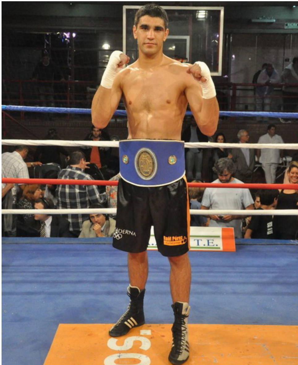
Эзекьель Освальдо Мадерна