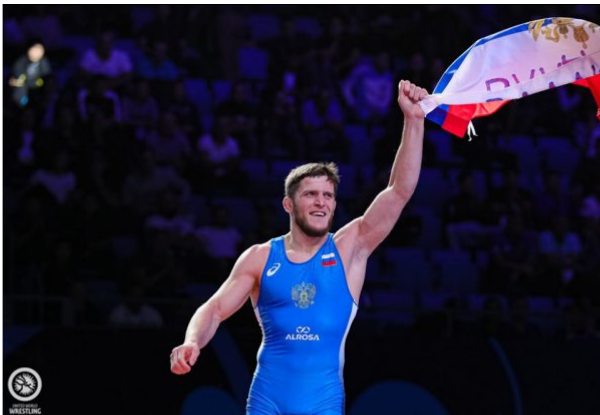
Абуязид Манцигов – чемпион мира-19