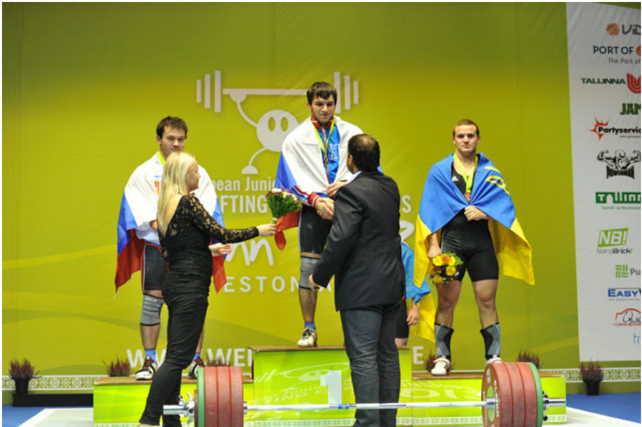
Чемпион Европы среди юниоров