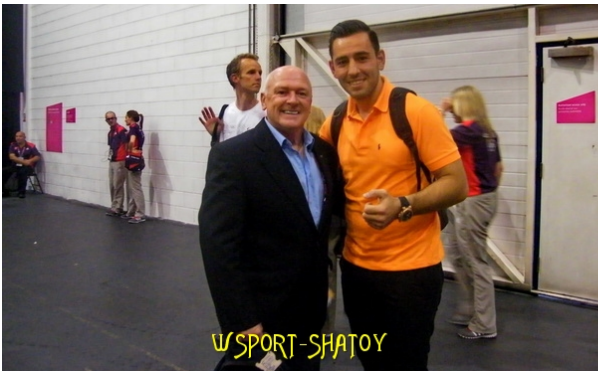
С телеведущим борцовских соревнований