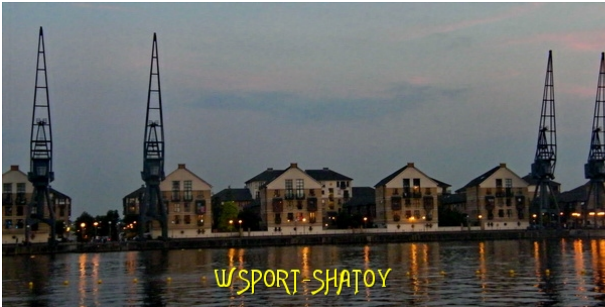
Вид от EXCEL через Темзу