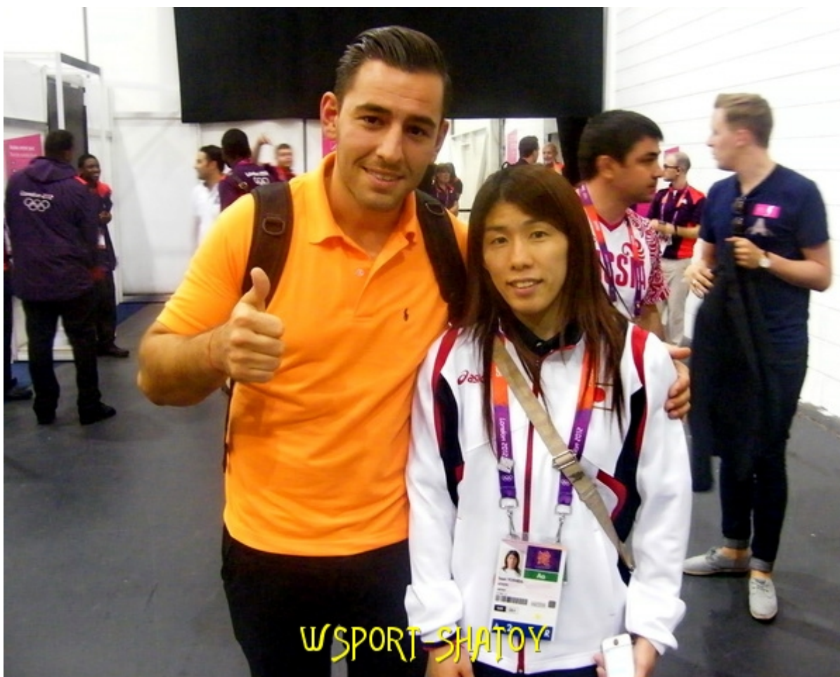
3-кратная олимпийская чемпионка Саори Йошида (Япония)