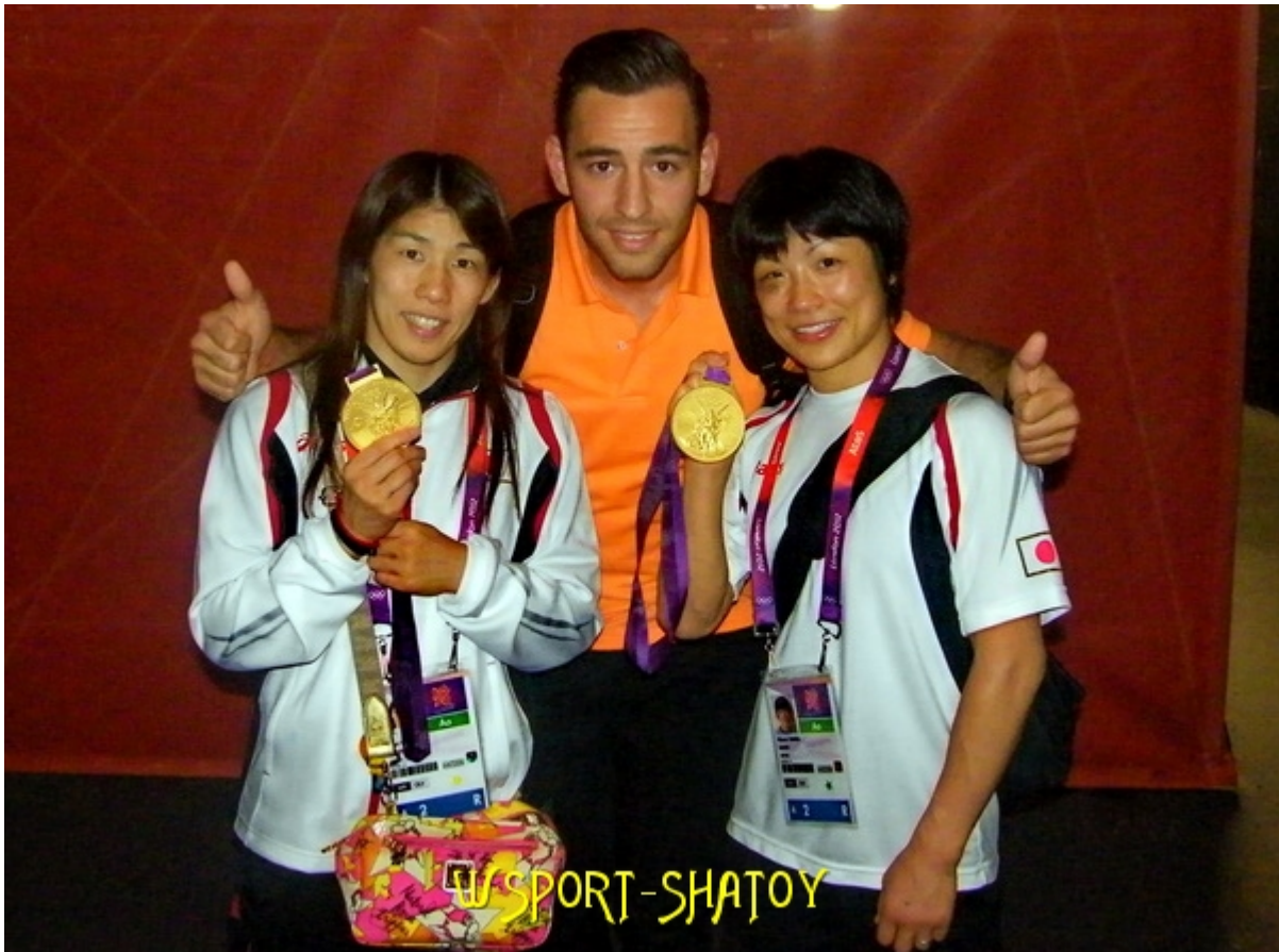
3-кратная олимпийская чемпионка Саори Йошида и олимпийская чемпионка Хитоми Обара