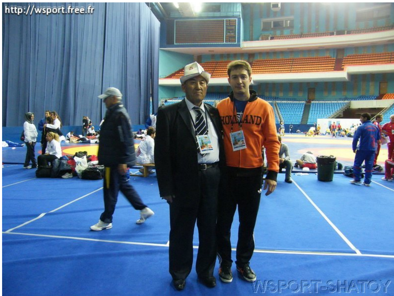
Представитель Федерации спортивной борьбы Кыргызстана