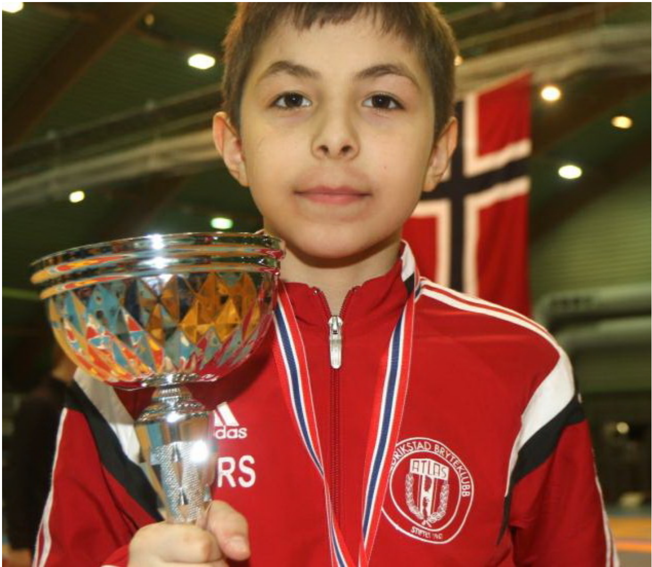
Чемпион Норвегии Лорс Тимирбиев