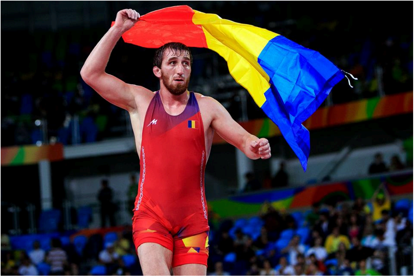
Альберт Саритов. Олимпийские Игры - 2016, Рио-де-Жанейро, Бразилия.