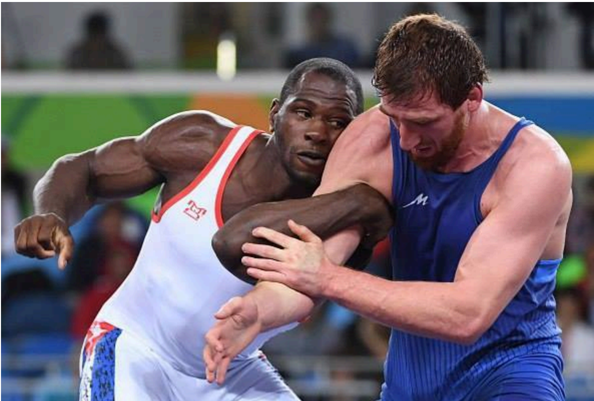
Альберт Саритов. Олимпийские Игры - 2016, Рио-де-Жанейро, Бразилия.