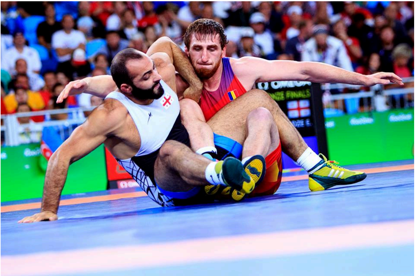
Альберт Саритов. Олимпийские Игры - 2016, Рио-де-Жанейро, Бразилия.