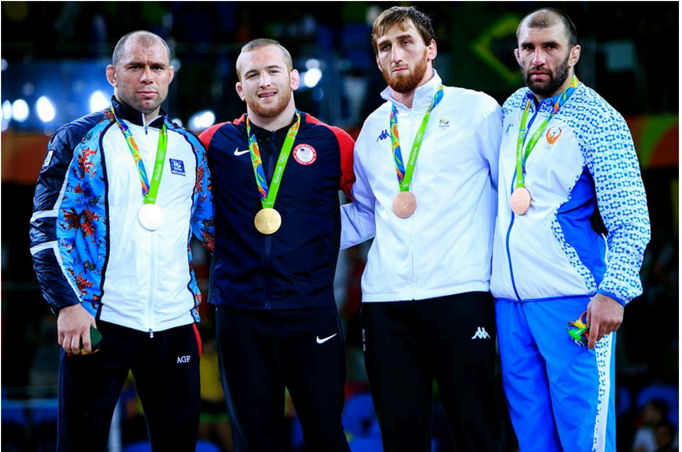
Альберт Саритов. Олимпийские Игры - 2016, Рио-де-Жанейро, Бразилия.