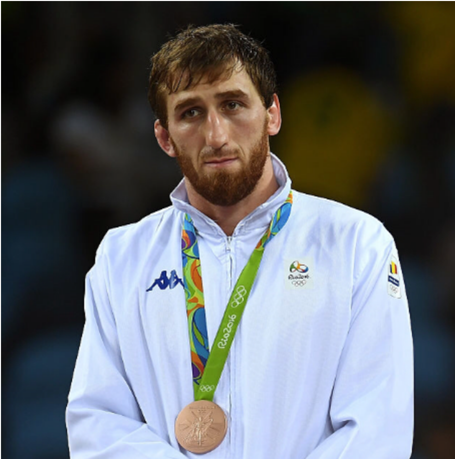
Альберт Саритов. Олимпийские Игры - 2016, Рио-де-Жанейро, Бразилия.