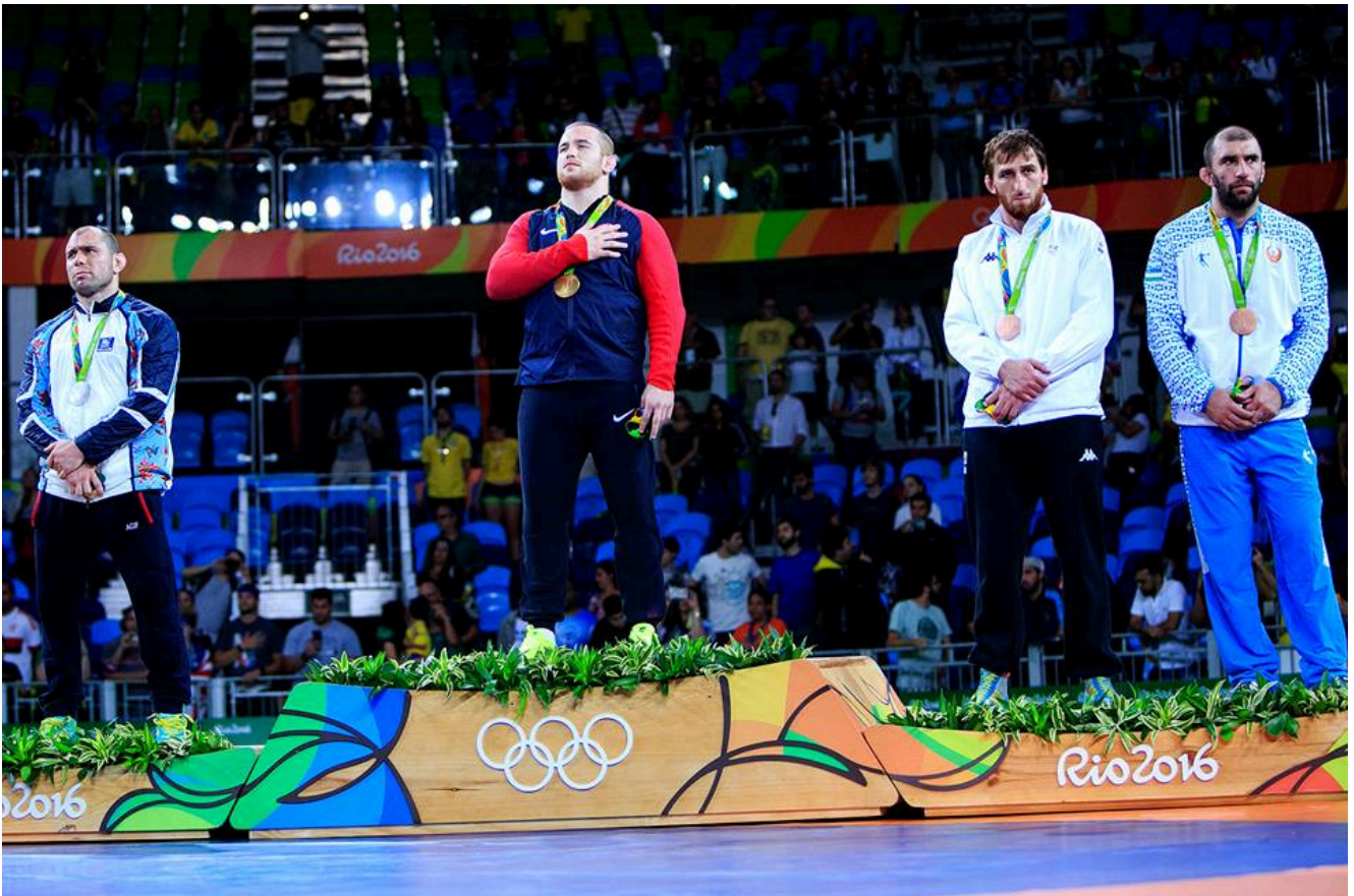
Альберт Саритов. Олимпийские Игры - 2016, Рио-де-Жанейро, Бразилия.