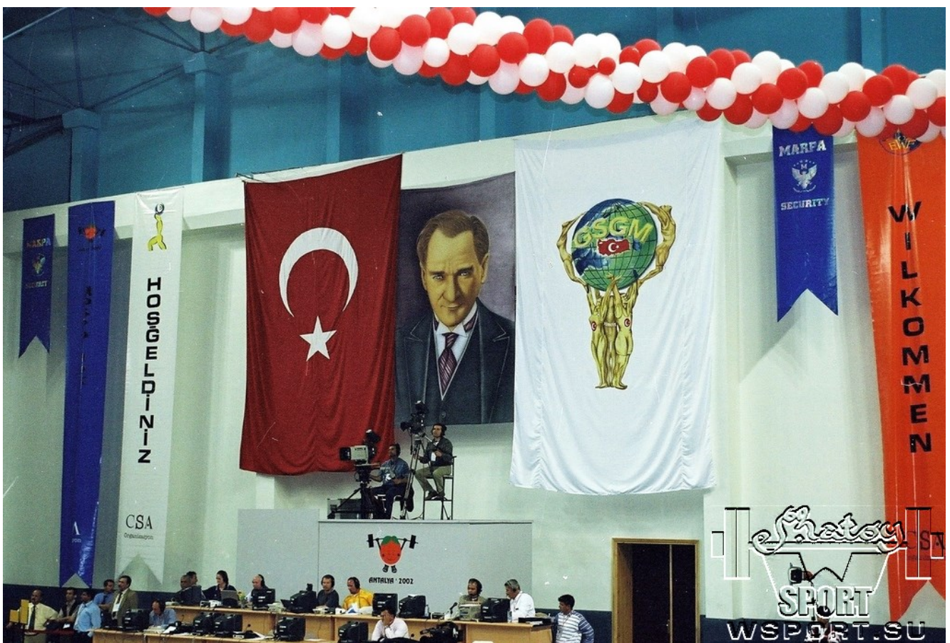
Под оком Ататюрка