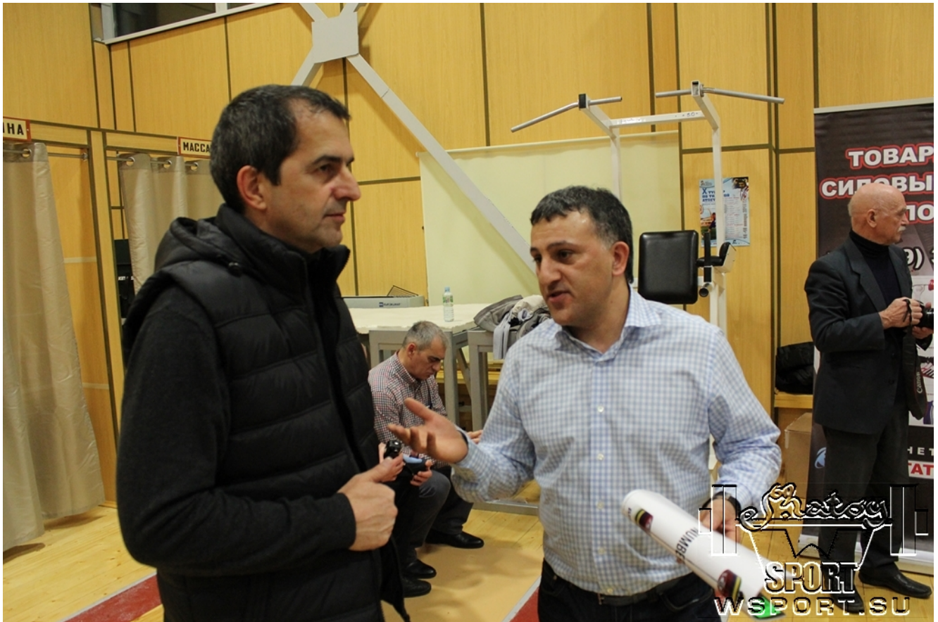
Представитель турецкой компании- производителя штанг Werksan.