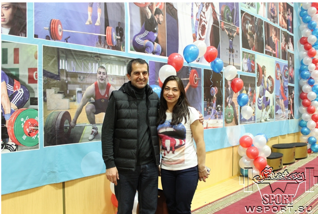
Надежда Евстюхина - 2-кратная чемпионка мира и Европы, бронзовый призер Олимпиады-2008