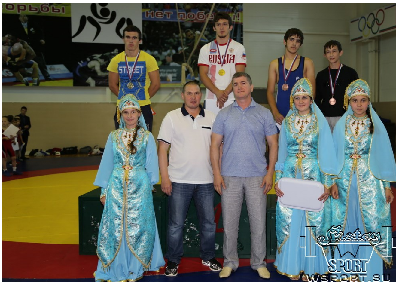
Награждение призеров III-го Всероссийского турнира "Дружба"