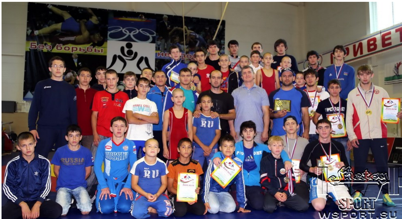
Команды Чувашии и Чечни