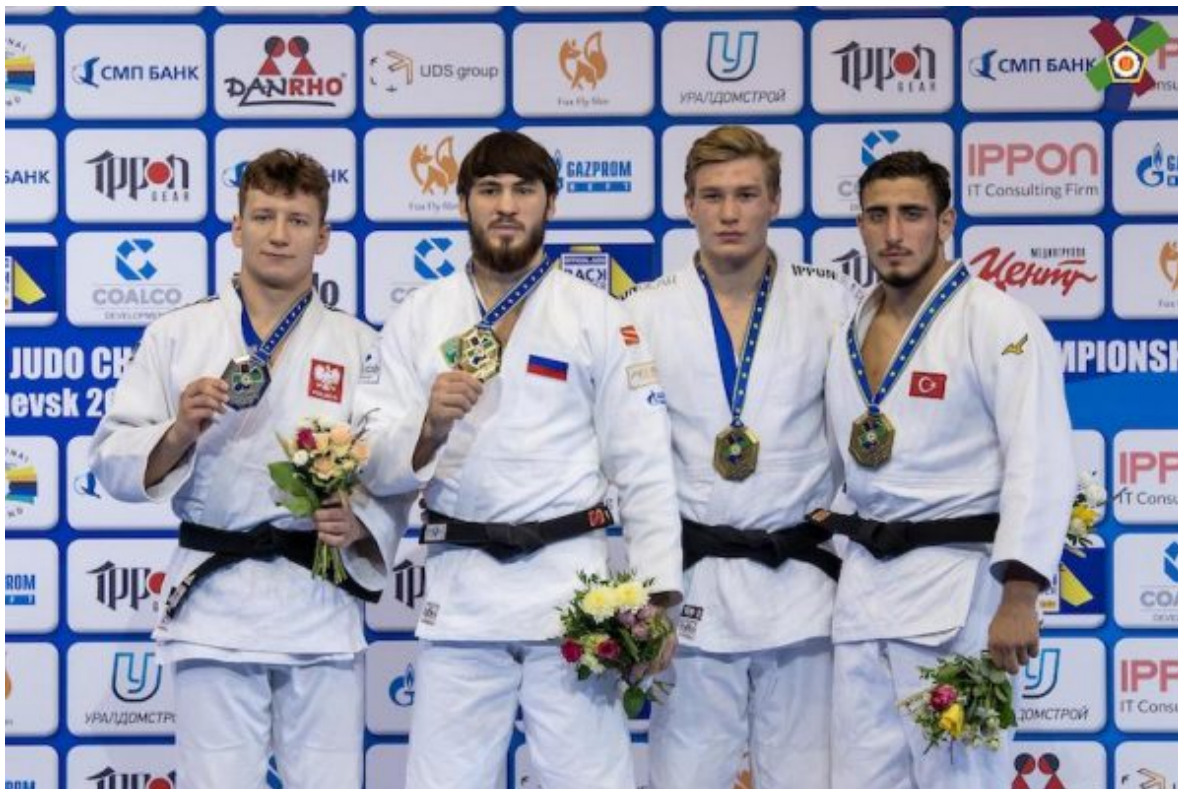
Турпал Тепкаев – чемпион Европы-19 среди юниоров до 23 лет