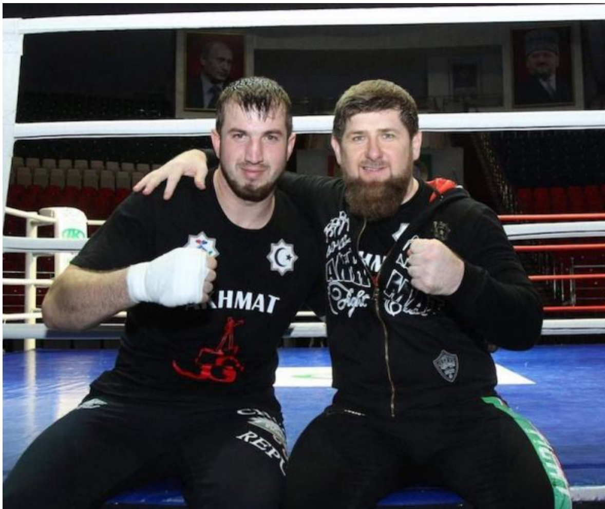
Апти Давтаев и Рамзан Кадыров