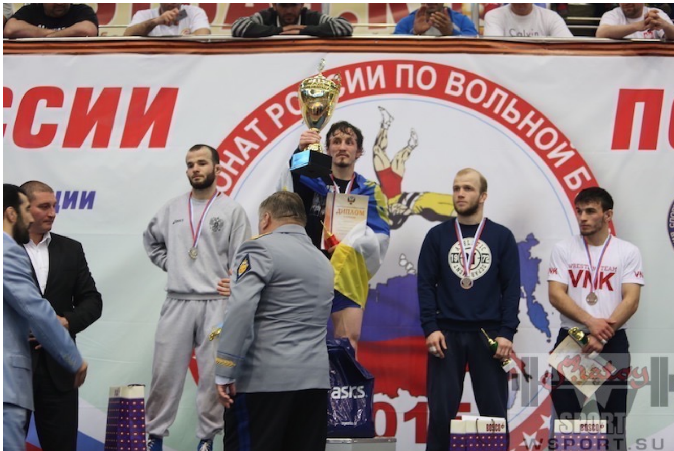
Награждение призеров весовой категории 61 кг