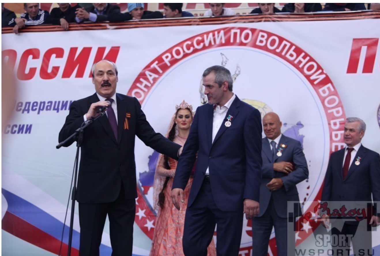
Глава Дагестана Рамазан Абдулатипов наградил Бувайсара Сайтиева орденом «За заслуги перед Республикой Дагестан»