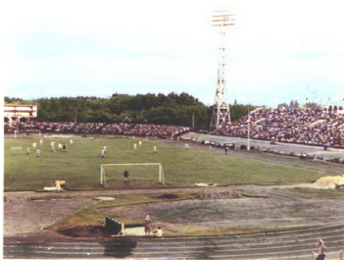
Стадион «Динамо», г. Грозный. Stadium «Dinamo», Groznyi.