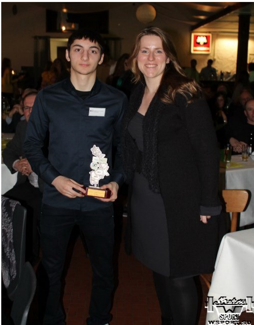
С министром спорта В.Бельгии И.Вейкманс [youtube id=»K-0HmGdLQyM» width=»600″ height=»350″]