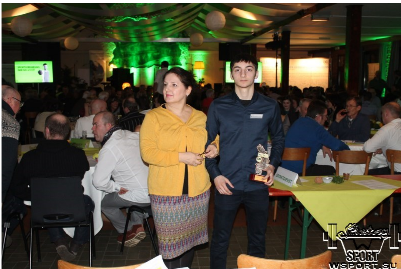
Фото с виновником торжества