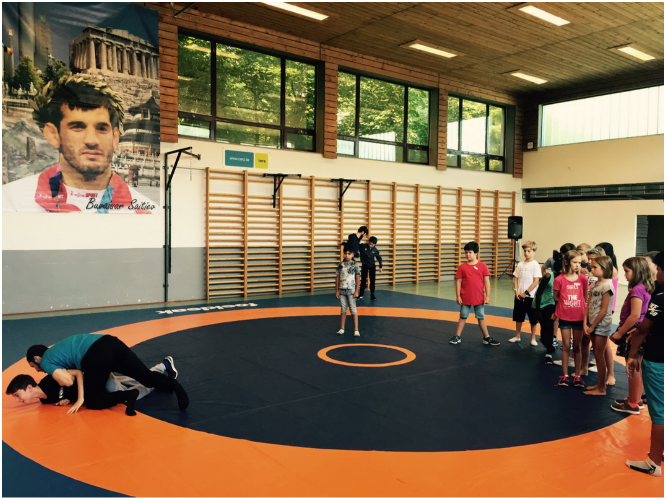
Открытая тренировка в БК Сайтиев.