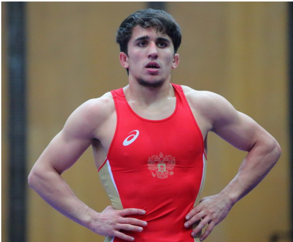
Имам Аджиев.

Ахмед Чакаев проиграл на «туше» Скрябину в 1/4 финала. В малом финале он сумел взять верх над Муршидом Муталимовым и завоевал бронзовую медаль.